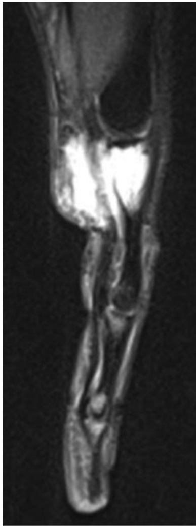
Fig. 3 Ressonância magnética nuclear, T2, invasão tumoral endomedular com extensão aos tecidos moles.

tendões flexores, sobretudo na sua vertente posterior e anterointerna.