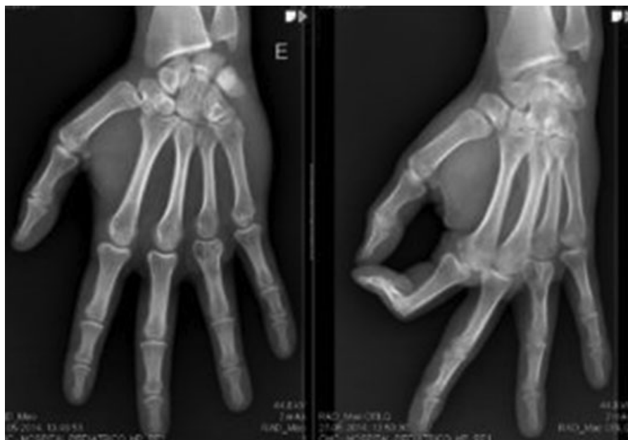
Fig. 8 Controle após 17 meses de pós-operatório.