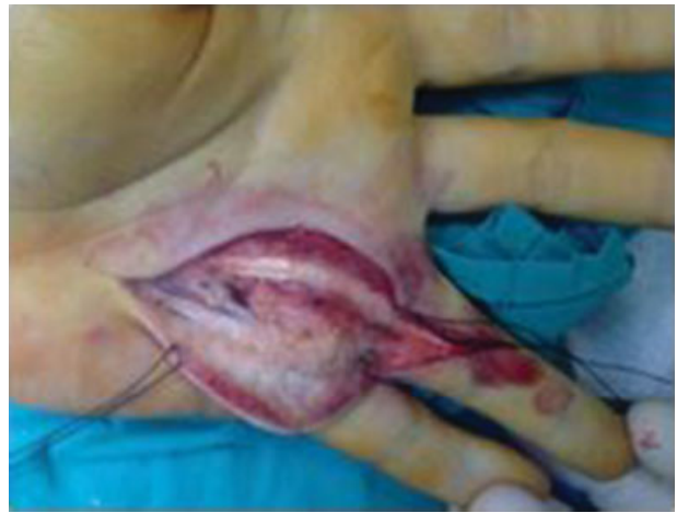
Fig. 4 Invasão tumoral dos tecidos moles rodeando os tendões flexores.

No exame macroscópico dos fragmentos biopsados, observavam-se formações nodulares constituídas por tecido esbranquiçado e firme. Microscopicamente, as áreas nodular compreendem proliferação de células de núcleo relativamente monomórfico, ovalado, com cromatina fina, mostrando citoplasma eosinófilo de limites mal definidos. Multifocalmente, observou-se agregação celular tipo “glo-