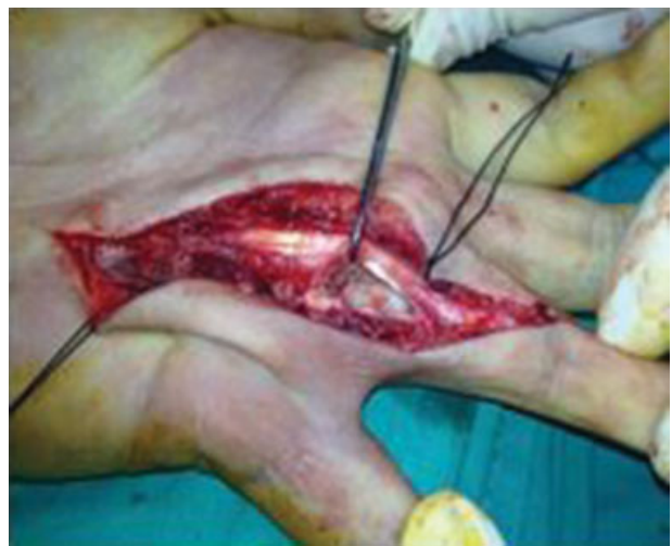
Fig. 5 Lesão tumoral intraóssea com destruição da cortical.

meruloide” centrada por pequeno capilar sanguíneo. A proliferação mostrou ser negativa para o antígeno da membrana epitelial (AME), mas foi fortemente imunorreativa para a proteína S100 (► Fig. 7). Tratava-se, portanto, de uma proliferação neoplásica de tecidos moles com diferenciação Schwânica com características histomorfológicas celulares e de estrutura que a enquadravam num neurotequeoma.