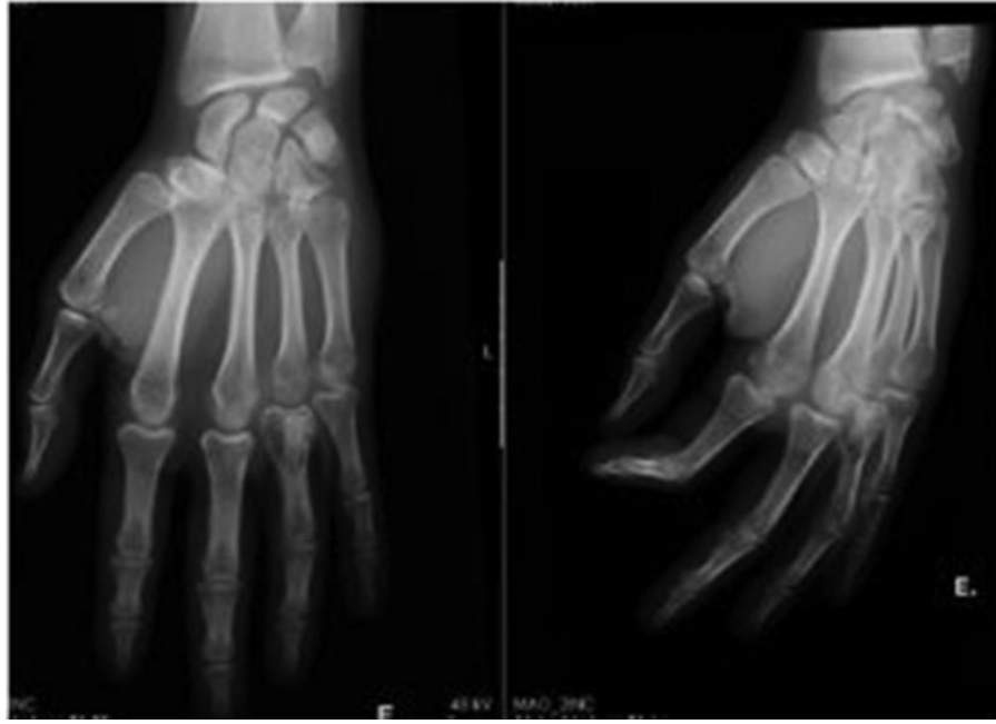
Fig. 6 Raio-X pós-operatório com visualização do enxerto ósseo autólogo corticoesponjoso.