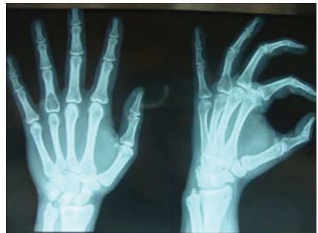
Fig. 2 Lesão intraóssea, lítica, septada, com insuflação da cortical, localizada na base da falange proximal do 4º dedo da mão esquerda.