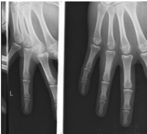
Fig. 1 Controle radiológico no seguimento do hospital de origem, em 2010.

Na ressonância magnética (RM) feita em 10 de outubro de 2012, observa-se, na vertente posterior dos tendões flexores do 4º dedo, uma lesão tumoral lobulada com epicentro na medula óssea da falange proximal do 4º dedo, hipointensa em T1, hiperintensa e ligeiramente heterogênea nas imagens ponderadas em T2 e densidade de prótons (DP) (►Fig. 3). Essa lesão condicionava insuflação da medula da porção proximal da primeira falange do 4º dedo, com aparente ruptura e erosão da cortical, envolvendo e rodeando os