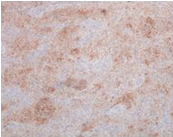
Fig. 7 Fotomicrografia do neurotequeoma com coloração imuno-histoquímica para proteína S100 (100 ×).

tumoral benigna com presumível origem na bainha nervosa. O termo neurotequeoma foi descrito por Gallager e Helwing em 1980 (do grego: theke – bainha) para conotar a aparência histológica em ninho. 2 Apesar das suas características serem sobreponíveis a outros tumores do tecido nervoso, como Schwannoma ou neurofibroma, é uma entidade clinicopatológica distinta. 4