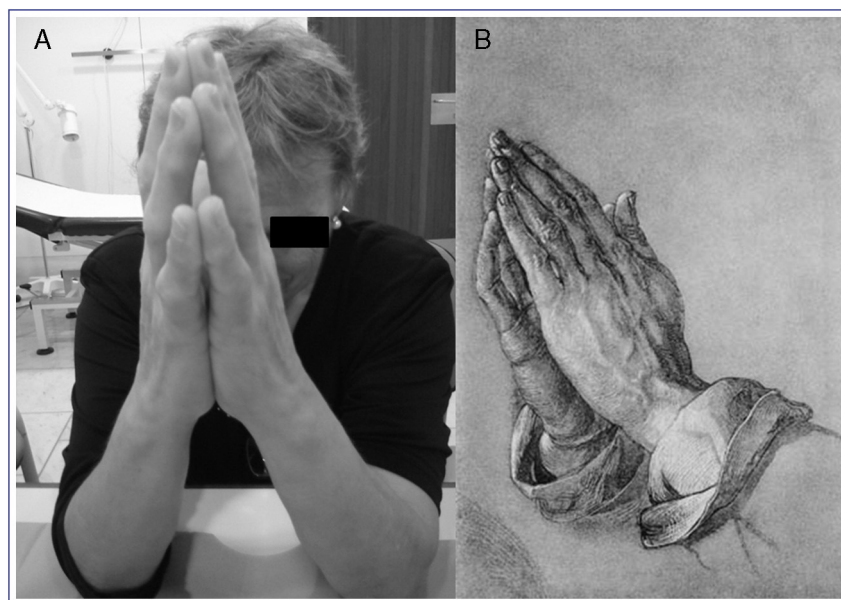
Figura 1 A) Signo de la oración en una paciente diabética donde se observa la incapacidad de oponer por completo las superficies palmares de los dedos. B) Estudio realizado por Alberto Durero (1471-1528) de las manos de un apóstol en actitud de oración.