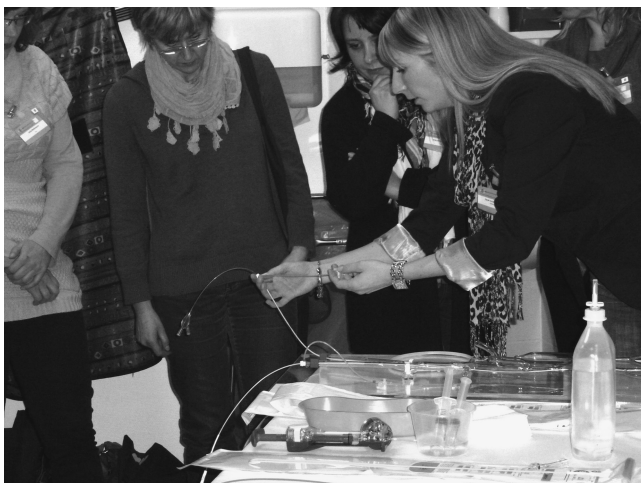
Abb. 2 Hands-On: Materialkunde am Gefäßmodell: Gewusst wie!