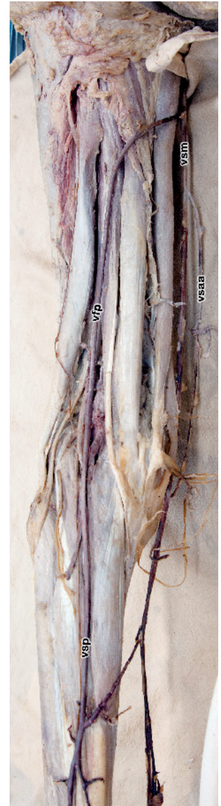
Abb. 5 V. femoropoplitea („ Giacomini-Vene “): Die V. saphena parva setzt sich als nahezu gleichkalibrige V. femoropoplitea auf den Oberschenkel fort; diese windet sich um den proximalen Oberschenkel und mündet in die V. saphena magna . Im Bereich der Kniekehle besteht eine kräftige Perforans („ Crosse “) zur V. poplitea . linkes Bein. Eigene Abbildung, Sezierskurspräparat.

Aus dieser generellen Situation ergeben sich je nach Ausprägung der einzelnen