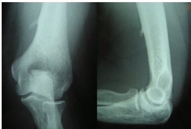
Fig. 1 Radiografias (incidência de face e perfil) do cotovelo esquerdo onde se observa a apófise supracondilar do úmero distal.

A paciente foi submetida à cirurgia para excisão desta estrutura por uma via anterior do úmero distal. Intraoperatóriamente confirmou-se a compressão do nervo mediano