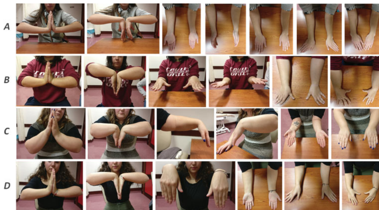
Fig. 6 Fotografia clínica da mobilidade pós-operatória do punho e antebraço. A – paciente com procedimento cirúrgico bilateral; B – paciente com procedimento cirúrgico bilateral; C – paciente com procedimento cirúrgico à esquerda; D – paciente com procedimento cirúrgico à direita.

Abreviações: \Delta , variação; DASH, disabilities of the arm, shoulder and hand; EVA, escala visual analógica.