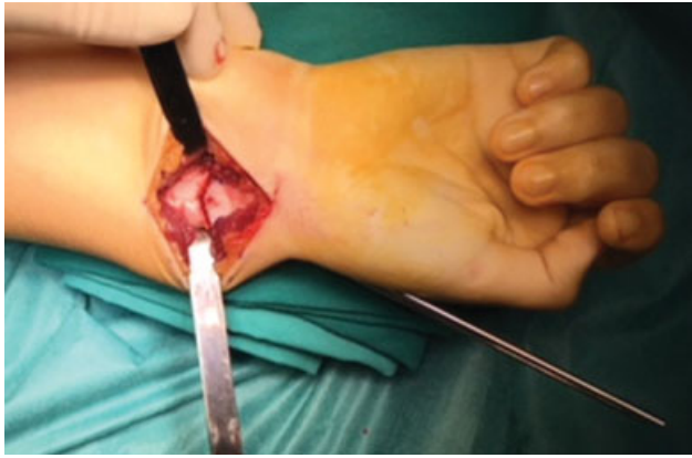
Fig. 4 Realização da osteotomia em cúpula de concavidade distal da região metafisária do rádio distal com osteótomos curvos.

fragmento proximal. É feito o controle fluoroscópico da redução e fixação alcançadas (► Figura 5 ). Dobram-se e cortam-se os fios K, deixando fora da pele uma extremidade que permita a sua remoção na consulta. Realiza-se profilaticamente uma fasciotomia volar limitada e inicia-se o encerramento reaproximando parcialmente o retalho do pronator quadratus com fio absorvível. Encerra-se o tecido celular subcutâneo e a pele com fio absorvível. Realiza-se uma imobilização gessada antebraquial, que se bivalva no bloco operatório, prevenindo o risco de edema/síndrome compartimental pós-cirúrgicos.