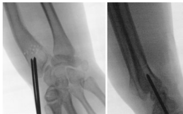
Fig. 3 Introdução de 2 fios de Kirschner (2.0/2.4mm) paralelos ou divergentes ao nível da estilóide radial e orientados no sentido da região metafisária do rádio distal previamente fenestrada, sem a ultrapassar.