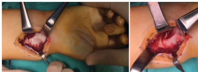
Fig. 1 Abordagem volar do rádio com identificação, secção e excisão do ligamento de Vickers.

Foram analisados os seguintes parâmetros: dados demográficos (gênero, idade de diagnóstico e lateralidade), idade à data da cirurgia, técnica cirúrgica, tempo de consolidação óssea e resultados radiográficos e clínicos. A avaliação radiográfica pré e pós-operatória foi realizada através da medição da inclinação ulnar, afundamento do semilunar, ângulo da fossa semilunar e desvio palmar do carpo. 14 Estas medições foram efetuadas através de exame radiográfico do punho e do antebraço (anteroposterior e perfil), realizado na nossa instituição. Considerou-se o raio-X pré-operatório como o mais próximo da data de cirurgia. A avaliação clínica pós-operatória foi realizada em consulta médica e consistiu na medição das amplitudes articulares do punho e do antebraço, na aplicação da escala visual analógica (EVA) (com avaliação da dor, do défice funcional, do impacto estético e da recomendação do procedimento cirúrgico) e do score Disabilities of the Arm, Shoulder and Hand (DASH, na sigla em inglês). 18 A realização do estudo é autorizada pela Comissão de Ética da Instituição Hospitalar e os pacientes e suas famílias assinaram o termo de consentimento informado.