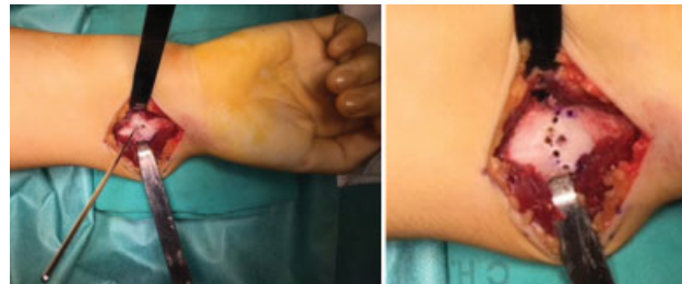
Fig. 2 Fenestração em cúpula de concavidade distal do córtex volar e dorsal da região metafisária do rádio distal com fio de Kirschner (1.6 mm).

Realiza-se uma abordagem volar do rádio através de uma incisão longitudinal ( \pm 7 cm), explorando o espaço entre o flexor carpi radialis e a artéria radial. Identifica-se o músculo pronator quadratus e eleva-se um retalho em “L” de base distal para exposição da face volar do rádio. Identifica-se o ligamento de Vickers, que é seccionado e excisado ( Figura 1 ). Sob observação direta e apoio de fluoroscopia, identifica-se a região metafisária do rádio a osteotomizar, evitando lesar a articulação radiocubital distal e a fise distal do rádio (quando presente). Realiza-se uma disseção subperiosteal circunferencial do rádio e, com um fio Kirshner (K) 1.2/1.6mm, inicia-se a fenestração em cúpula (de concavidade distal) do córtex da metáfise distal volar e dorsal do rádio ( Figura 2 ). Introduzem-se percutaneamente dois fios K de 2.0/2.4mm paralelos ou divergentes através da estilóide radial e orientados no sentido da região fenestrada da osteotomia, sem a ultrapassar ( Figura 3 ). Realiza-se a osteotomia em cúpula do rádio distal com osteótomos curvos ( Figura 4 ) e procede-se a uma manobra de redução com tração longitudinal, desvio radial, pronação e desvio dorsal do fragmento distal. Enquanto o cirurgião principal mantém a redução alcançada, o cirurgião ajudante avança os fios K através do foco da osteotomia até obter uma fixação cortical no