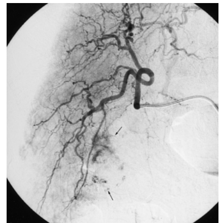
Abb. 2 (a) Arterielle DSA nach Sondierung der Arteria mesenterica superior. Der Sidewinderkatheter (offener Pfeil) wurde in die Arteria pancreaticoduodenalis inferior in superselektiver Lage platziert. Retrograde Füllung über die Pankreasarkaden in die Arteria gastroduodenalis. Die Pankreasarkade ist sehr kräftig und versorgt den rechten Leberlappen mit. Als Variante zweigt die Arteria gastroduodenalis distal der Arteria hepatica sinistra aus der Arteria hepatica communis ab. Darstellung des in Segment 5 gelegenen Tumors, der auch von Ästen der Arteria hepatica dextra gespeist wird (Pfeile). (b) Superselektive Sondierung der Arteria hepatica dextra an der Arteria gastroduodenalis vorbei. Kräftige tumorale Parenchymkontrastierung mit pathologischen Gefäßen und Kontrastmittelextravasat in Segment 5 (Pfeile).

ßen Polyvinylalkohol-Partikeln (Contour, Fa. Cook, Mönchengladbach) embolisiert (Abb. 3). Die abschließende Kontrollserie zeigte neben einem vollständigen Verschluss der tumorversorgenden Segmentarterien 5 und 6 als unerwünschtes Ergebnis auch einen Verschluss der Segmentarterien 7 und 8 durch Verschleppung des Embolisates in den oberen Ast der Arteria hepatica dextra (Abb. 4). Die Arteria hepatica