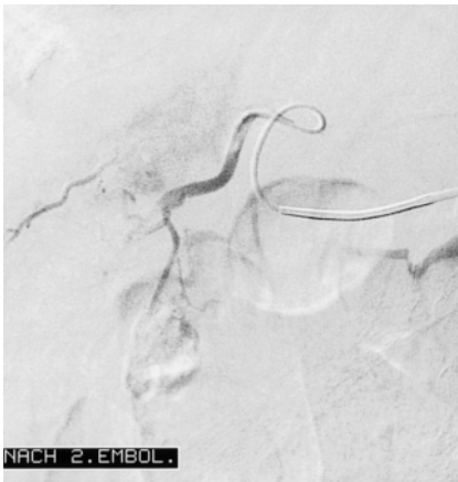
Abb. 3 Nach Platzierung eines Terumo-Radiofokus 3-F-Coaxial-Katheters wurde superselektiv im unteren Ast der rechten Leberarterie (Segment 5/6) mit Polyvinylalkohol embolisiert. Verschluss der tumorversorgenden Äste aus den Segmentarterien 5 und 6. Deutliche Kontrastmittelstase.