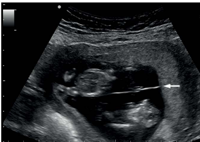
Abb. 4 Monochoriale-biamniotale Gemini-Gravidität mit T-Zeichen (→), 12 kpl. SSW.

des intrauterinen Fruchttods (IUFT) oder der Anämie-Polyzythämie-Sequenz (TAPS) zu beachten [27].