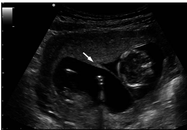
Abb. 3 Bichoriale Gemini-Gravidität mit λ-Zeichen (→), 12 kpl.SSW.