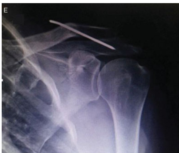
Fig. 4 Nove meses de pós-operatório, ombro esquerdo.

O paciente foi perguntado sobre sintomas adicionais e mencionou que nas semanas anteriores sentira desconforto na região posterior da cervical.