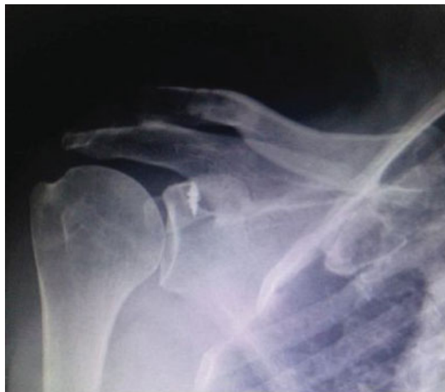
Fig. 5 Nove meses de pós-operatório, ombro direito.

O paciente foi perguntado sobre sintomas adicionais e mencionou que nas semanas anteriores sentira desconforto na região posterior da cervical.