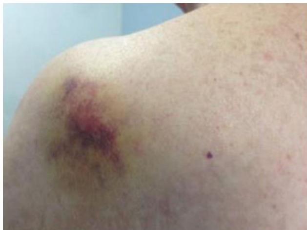
Fig. 2 Hematoma e uma pequena saliência na pele, ombro esquerdo, nove meses de pós-operatório.