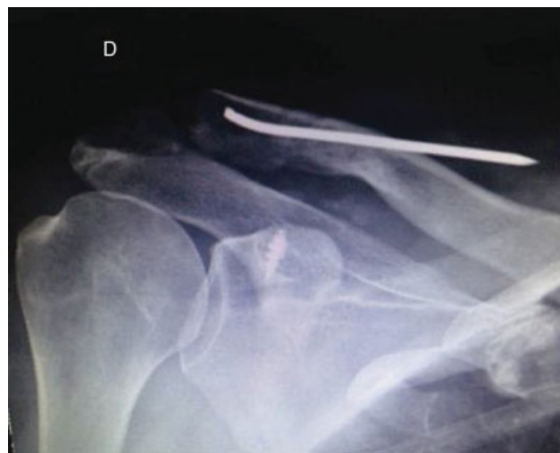
Fig. 1 Pós-operatório de 15 dias, ombro direito.

Em seis meses não retornou conforme solicitado. Após nove meses do tratamento cirúrgico, iniciou com dores no ombro esquerdo (lado contralateral), dificuldade para mobilizar no arco de movimento, equimose e saliência (▶ Figs. 2 e 3 ). Radiografou-se bilateralmente e constatou-se que o fio de Kirschner originalmente do ombro direito estava no esquerdo (▶ Figs. 4 e 5 ).