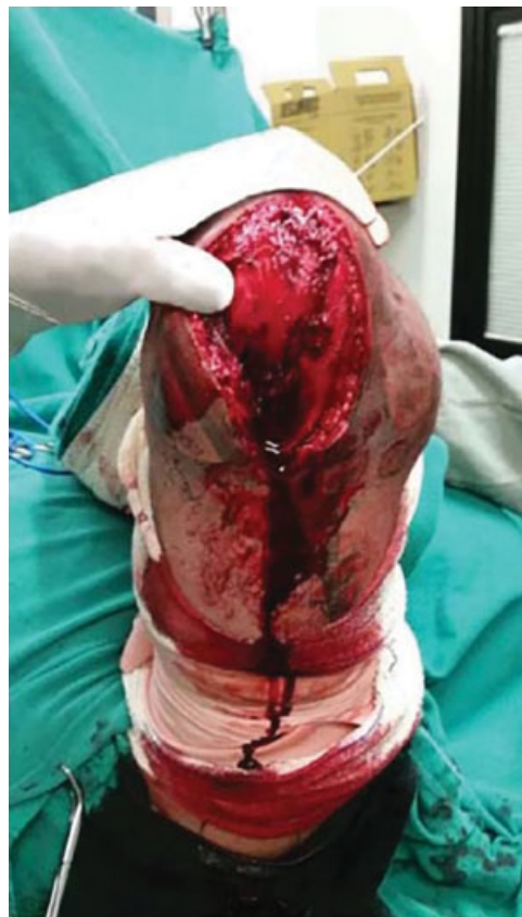
Fig. 1 Acesso posterior cirúrgico.

O paciente foi avaliado através do dinamômetro isocinético (CybexII+, Nova York, NY, Estados Unidos) no pré-operatório e 5 meses após a cirurgia. Foi avaliada a flexoestensão. O braço direito foi usado como o lado controle.