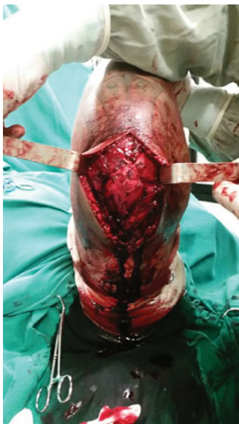
Fig. 3 Configuração final do reforço feito com enxerto do tendão do palmar longo.