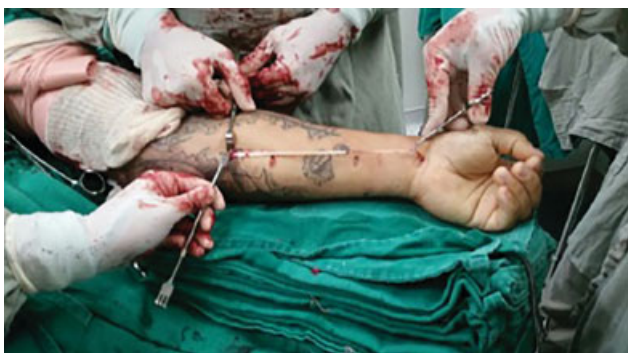
Fig. 2 Retirada do enxerto (tendão do musculo palmar longo).