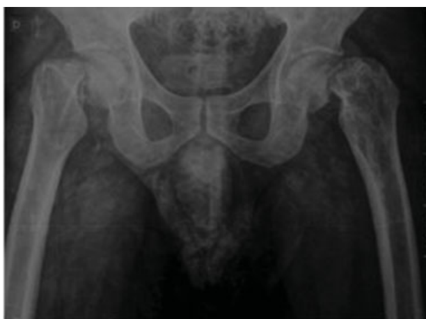
Fig. 1 Radiografia anteroposterior da bacia pré-operatória.

Paciente de 36 anos, masculino, branco, e trabalhava como motoboy. História prévia de traumatismo crânio encefálico havia 4 anos, submetido a procedimentos neurocirúrgicos. Referia episódios convulsivos desde então, em uso contínuo de fenitoína e acompanhamento neurológico regular, porém persistia com episódios convulsivos.