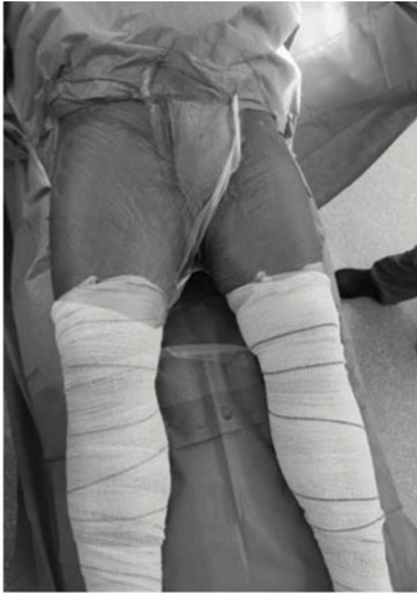
Fig. 3 Posicionamento e preparo do paciente.