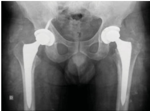
Fig. 4 Radiografia anteroposterior da bacia pós-operatória.

aumentado de fraturas. 4,5 Homens de meia-idade com epilepsia mal controlada são os pacientes mais sujeitos às fraturas pós-convulsão, devido à musculatura mais desenvolvida. 5 No caso apresentado, acredita-se que a causa da fratura tenha sido multifatorial, tanto pela osteopatia secundária à fenitoína como pelas contraturas tônico-clônicas, não foi a convulsão a causa, mas sim o evento desencadeante das fraturas.