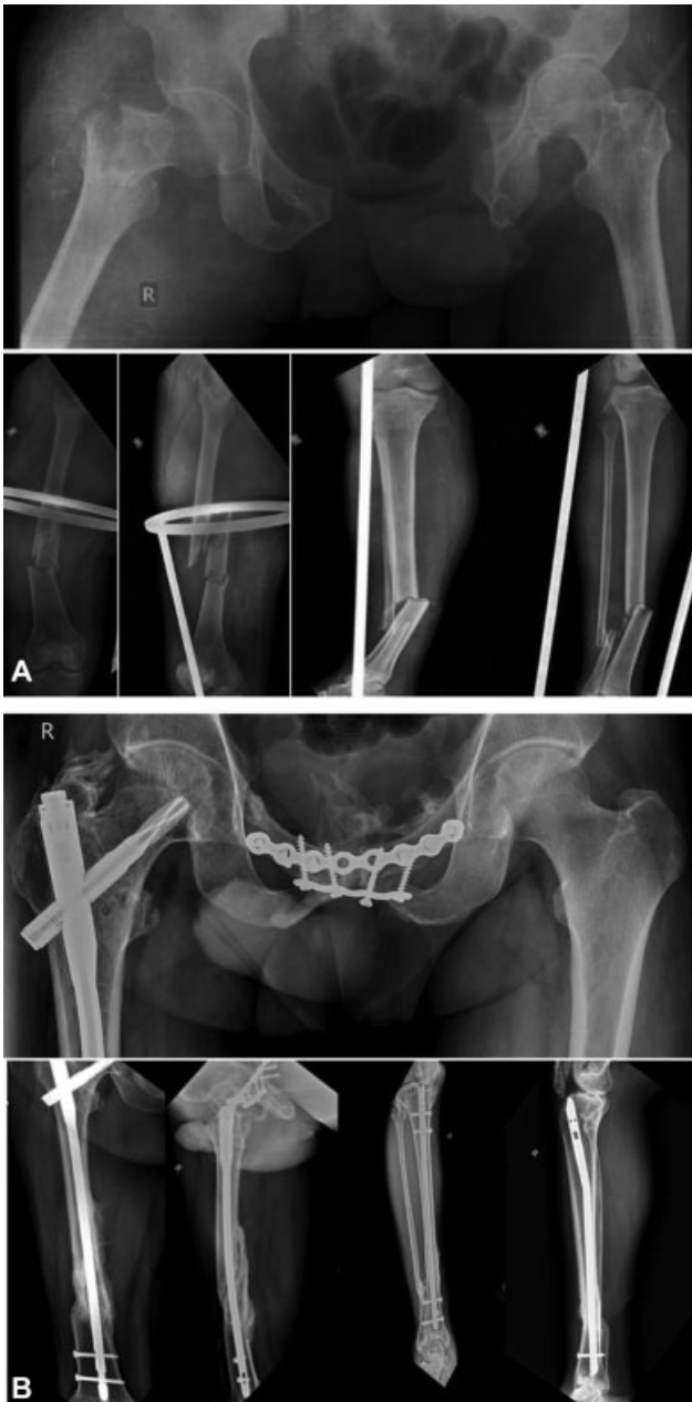
Fig. 1 (A) Radiografia pré-operatória de lesão do tipo joelho flutuante de tipo 1; e (B) aos 2 anos de acompanhamento.