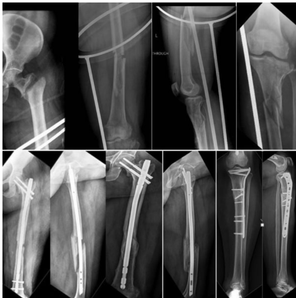
Fig. 2 Lesão do tipo joelho flutuante de tipo 2 aos 7 anos de acompanhamento. A dinamização foi realizada devido à união óssea tardia do fêmur em 3 meses.

pacientes limítrofes. Alguns autores indicam o ETC para todos os pacientes, exceto aqueles em estado mais crítico, e alguns indicam o DCO e a estabilização esquelética tardia. 10,11 A literatura também relata a utilidade da medição do nível sérico de lactato para a determinação do momento de tratamento e da mortalidade, mas seu papel ainda é controverso na previsão da sobrevida após uma lesão grave. 12,13 Em nosso estudo, não medimos o nível sérico de lactato. Em conclusão, o tratamento de pacientes politraumatizados deve ser individualizado após a avaliação do benefício da fixação definitiva precoce da fratura em comparação com o possível risco de complicações sistêmicas fatais, como embolia gordurosa, lesão pulmonar aguda ou falência múltipla de órgãos. 14