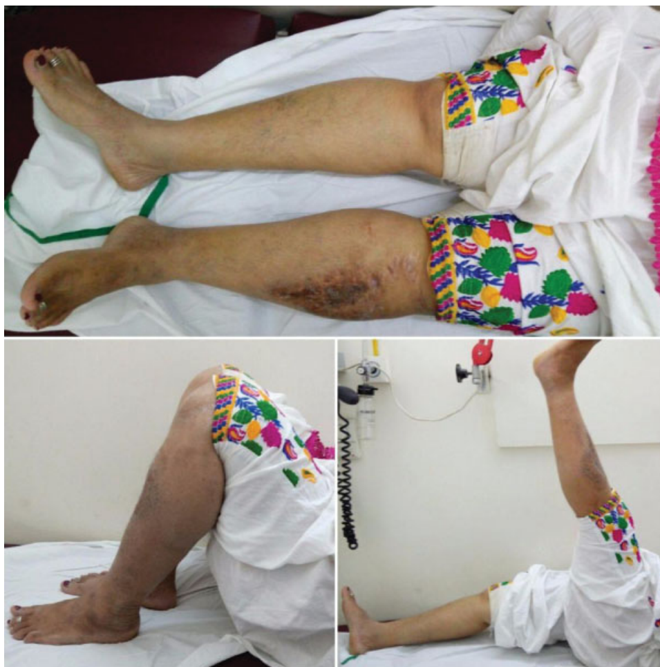
Fig. 3 Avaliação funcional do paciente da ►Fig. 2 em 7 anos.