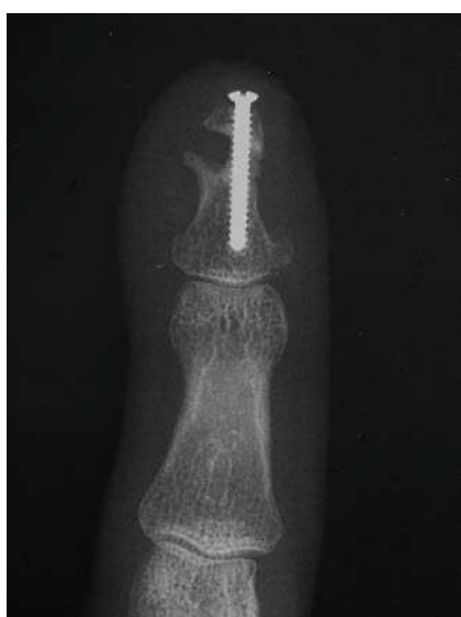
Figura 3 Aspecto de la consolidación parcial del caso 3.

Por vía dorsal se realizó una osteotomía correctora entre la inserción del tendón extensor y el inicio de la matriz ungueal que se fijó con dos tornillos de 1 mm compact hand (DePuy-Synthes, West Chester, PA, EE.UU.) que consolidó sin incidencias a las 8 semanas (fig. 4B y 4C) y presentando una movilidad de 0°/75° en la IFD a los 5 meses.