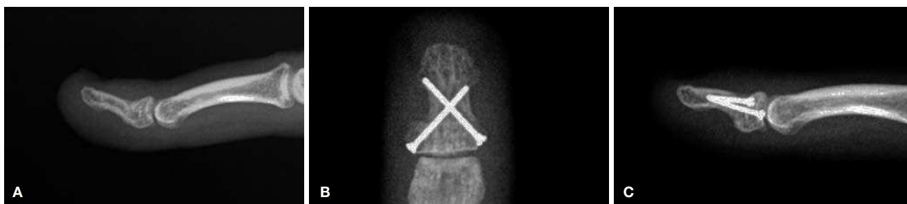
Figura 4 (A) Angulación dorsal de una mala unión de la falange distal correspondiente al caso 4. (B) Se observa la colocación de los dos tornillos de minifragmentos de 1 mm de diámetro entrados desde la parte lateral de la base de la falange. Los tornillos tienen un buen agarre en la cortical opuesta. (C) Proyección lateral del mismo caso.

Barton 7 que, en su revisión, encontró tasas de no unión para los metacarpianos del 0,7% y para las falanges del 0,2%, aunque incluía a todas las falanges en la revisión. Van Oosterom 8 reportó un 6% de pseudoartrosis en fracturas de falanges tratadas quirúrgicamente. A pesar de una aparente baja prevalencia en algunas de las series, la no consolidación genera una considerable incapacidad para realizar labores de la vida diaria en el 70% de los pacientes 5 .