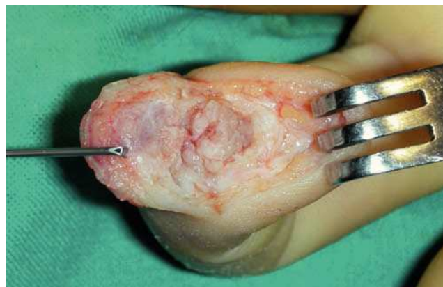
Figura 1 Acceso realizado en el caso 1. Nótese que la parte transversal de la incisión se sitúa justo en el límite del lecho ungueal.

Se obtuvo la consolidación radiológica a los 2 meses de seguimiento, estando el paciente asintomático en la última revisión, al año, y con una movilidad de la interfalángica distal (IFD) de 0°/55°.