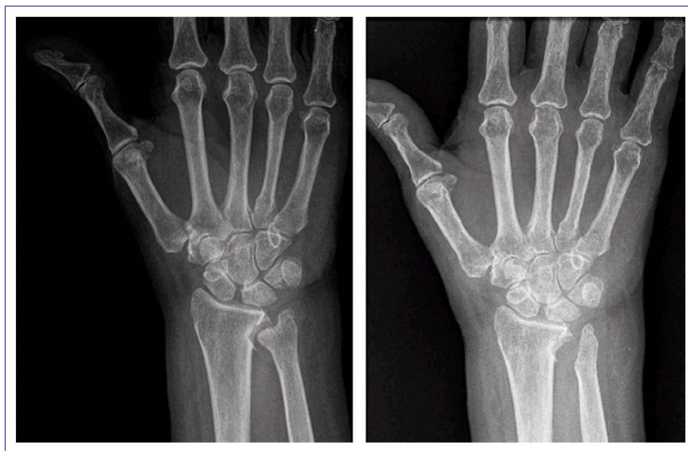
Figura 1 Radiología correspondiente al caso número 3: paciente afectado de artrosis radiocubital y varianza cubital minus . Se realizó técnica de Bowers.

El estudio radiológico preoperatorio constó de radiografía simple en proyecciones postero-anterior y lateral, donde se realizó la valoración de la morfología de la articulación radio-cubital, la presencia de subluxación dorsal de la cabeza cubital y el grado de artrosis según la escala de Kellgren-Lawrence 12 . La medición de la varianza ulnar 13 se realizó midiendo la distancia entre la línea trazada desde el borde distal volar del radio y la cortical distal del cúbito mediante el sistema Picture Archiving and Communication System. La valoración de la presencia de subluxación dorsal de la cabeza cubital se realizó por medio de una proyección lateral pura (superposición del semilunar, polo proximal del escafoides y el piramidal, con la estiloides radial centrada sobre el radio distal). Además de la radiografía simple, también utilizó en todos los pacientes la tomografía computarizada como parte de la planificación preoperatoria, ya que permite una mejor valoración de los osteofitos dorsales tributarios de exéresis.