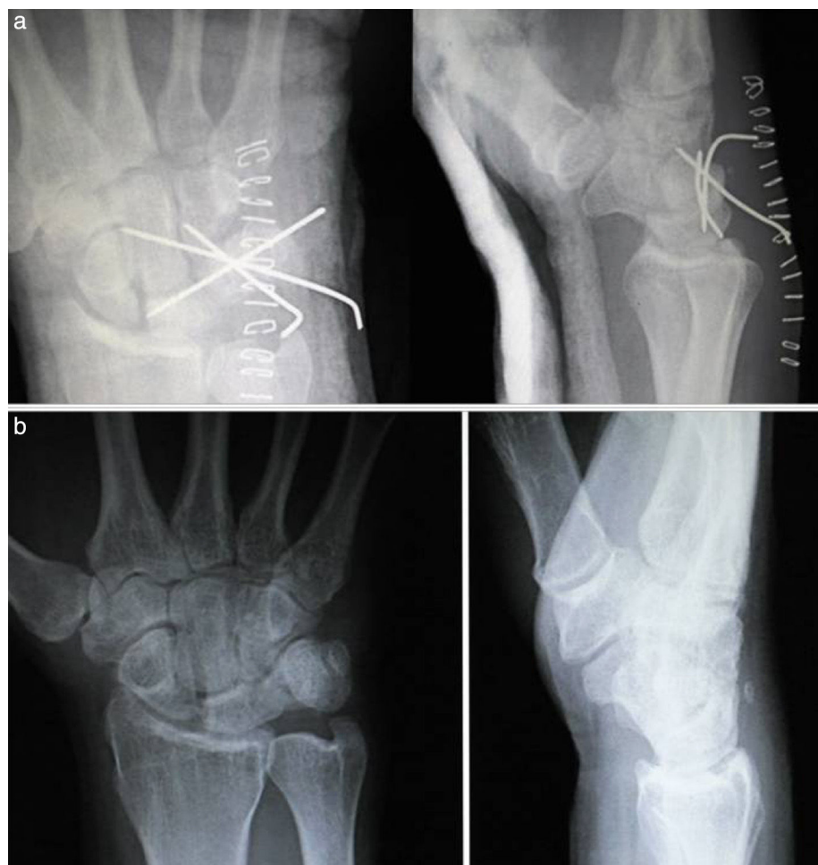
Figura 2 a) Control radiológico tras la reducción abierta y síntesis con agujas. b) Radiografías postoperatorias en el control realizado a los 4 años de la cirugía.