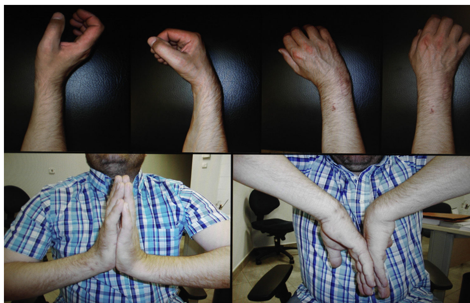
Figura 3 Movilidad postoperatoria.