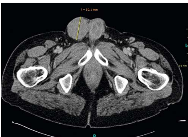
► Abb. 4 CT-Becken mit 50,1 mm großem Tumorrezidiv im Bereich des rechten Hodens.

Adalimumab wurde weiterhin pausiert. Unter der Chemotherapie und intensiverer Lokalthherapie zeigte sich eine zunehmende Besserung des Hautbefundes. Noch 3 Monate nachdem die Chemotherapie von dem Patienten selbstständig beendet wurde, bestand ein PASI von 0,6.