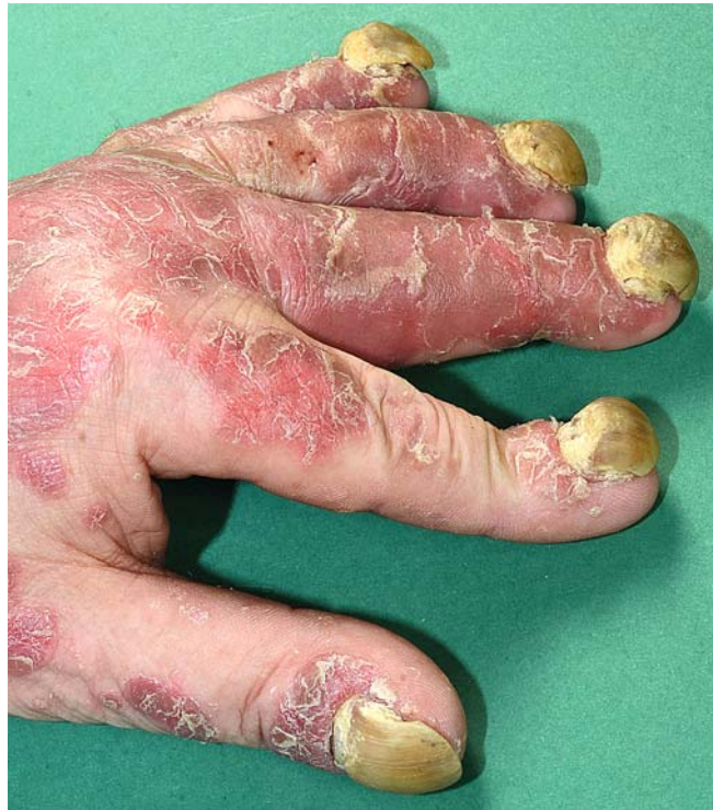
► Abb. 2 Nagelveränderungen i. R. der Psoriasis vulgaris 4 Monate nach Absetzen von Adalimumab.

pha-Fetoprotein i. S. von 190,1 ng/ml (Referenz < 10,9 ng/ml). Im CT stellte sich der V. a. eine regionale Weichteilmetastase und V. a. Lymphknotenmetastasen iliacal bds. Nach Resektion des Tumors zeigte sich histologisch wiederholt ein nicht-seminomatöser Keimzelltumor mit gemischten Anteilen eines Dottersacktumors und eines High-grade-Rhabdomyosarkoms. Das urologische Tumorboard entschied sich aufgrund der Staging-Ergebnisse zu einer Chemotherapie mit Epirubicin/Ifosfamid.