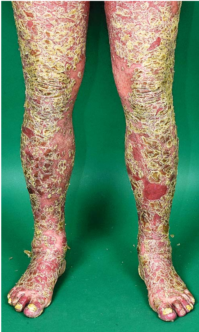
► Abb. 3 Befund der Psoriasis vulgaris an den unteren Extremitäten 4 Monate nach Absetzen von Adalimumab.