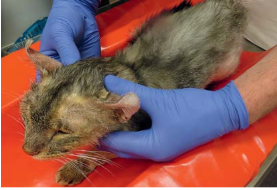
► Abb. 4 Katze mit Hyperkortisolismus: Alopezie und Teleangiektasie, aufgerollter Ohrrand aufgrund eines Aufweichens des Ohrknorpels.

Der Hyperkortisolismus bei der Katze ist sehr selten. Katzen mit Hyperkortisolismus zeigen häufig durch Knorpelerschließung ingerollte Ohrränder (► Abb. 4 ). Sie können eine so starke Hautfragilität entwickeln, dass diese spontan wie Pergamentpapier reißen und zu großflächigen Hautwunden führen kann. Alopezie und durchscheinende Hautgefäße sind wie beim Hund zu beobachten.