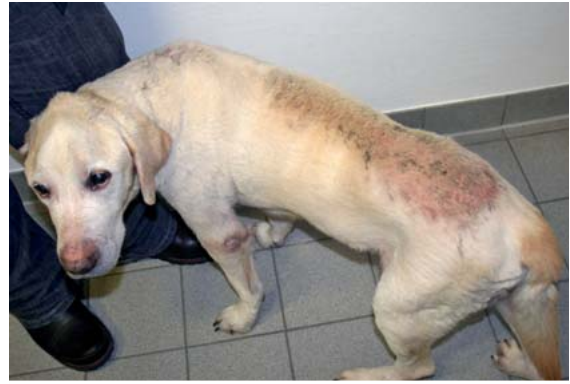
► Abb. 3 Calcinosis cutis: Flächige sandartige Plaques auf der Hals-/Rückenlinie eines Hundes mit Hyperkortisolismus.

Die Hautbarrierefunktion und die Hautimmunität dieser Patienten sind herabgesetzt, wodurch sekundäre Infek-