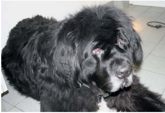
► Abb. 5 Hypertrichose bei einer Neufundländerhündin mit Akromegalie. Die Dicken- und Mengenzunahme der Haut kann wie ein Myxödem bei einem hypothyreoten Hund wirken.

1–3 Jahren werden sie zusehends apathisch und können Zysten im Gehirn bilden.