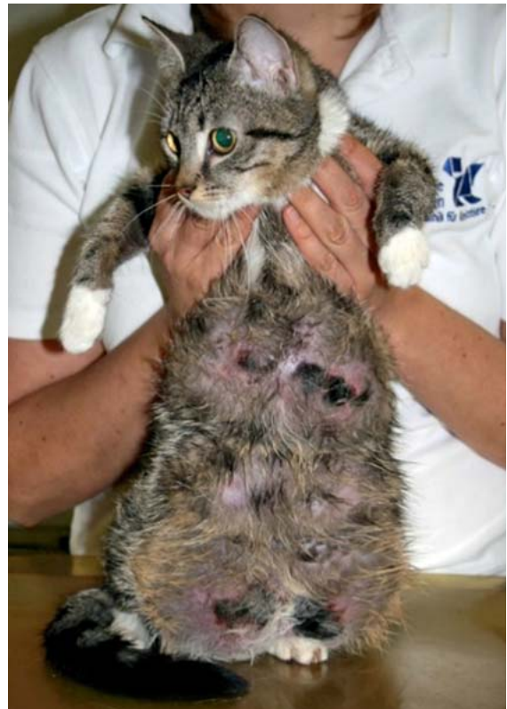
► Abb. 10 Hautulzerationen und Nekrosen infolge von Ischämie bei einer jungen Katze mit Fibroadenomatose.

bilateral-symmetrische Alopezie mit Hyperpigmentation hervorrufen. Die Vulva und Zitzen sind oft begleitend geschwollen und die Hündinnen haben vorberichtlich häufig abnorme Läufigkeitsverläufe . Auch eine Inkontinenztherapie mit Östrogenen kann bei kastrierten Hündinnen Symptome eines Hyperöstrogenismus hervorrufen. Bei beiden Geschlechtern kann ein Hyperöstrogenismus auch durch den engen Kontakt zu Hormoncremes der Besitzer ausgelöst werden.