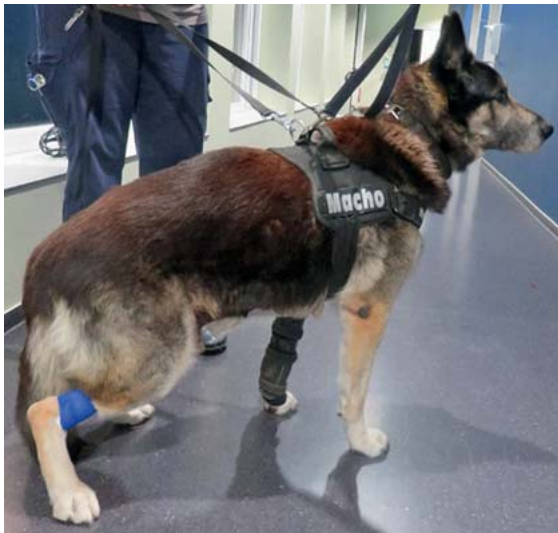
► Abb. 9 Rötliche Farbpigmentveränderung bei einem Rüden mit Sertolizelltumor.

bilateral-symmetrische Alopezie mit Hyperpigmentation hervorrufen. Die Vulva und Zitzen sind oft begleitend geschwollen und die Hündinnen haben vorberichtlich häufig abnorme Läufigkeitsverläufe . Auch eine Inkontinenztherapie mit Östrogenen kann bei kastrierten Hündinnen Symptome eines Hyperöstrogenismus hervorrufen. Bei beiden Geschlechtern kann ein Hyperöstrogenismus auch durch den engen Kontakt zu Hormoncremes der Besitzer ausgelöst werden.