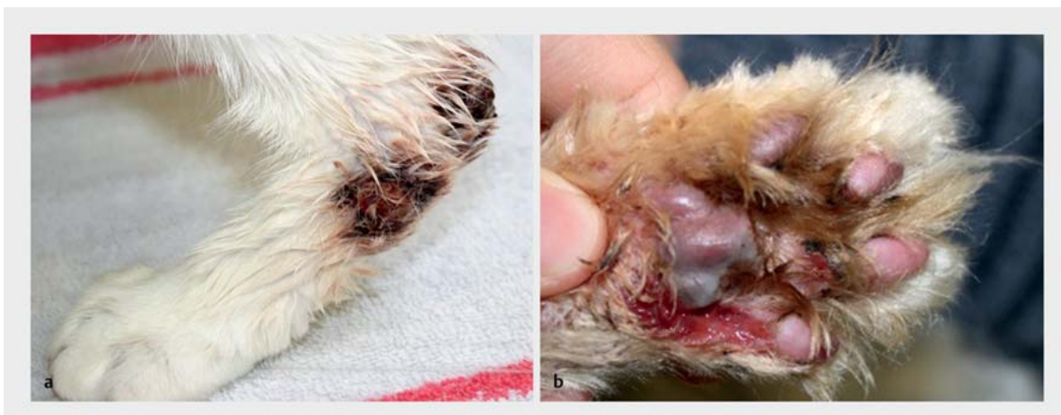
► Abb. 6 Xanthomatose bei einer Katze mit Diabetes mellitus. Ulzeröse Knoten an den distalen Gliedmaßen und Zehen mit Sekundärinfektion und Wundheilungsstörungen.

Diabetische Hunde, aber vor allem auch Katzen, können zudem eine Xanthomatose entwickeln (► Abb. 6 ). Xanthome sind granulomatöse, knotige Hautveränderungen, die durch einen abnormen Fettmetabolismus entstehen können, wie er unter anderem auch beim Diabetes mellitus vorkommt. Sie lagern sich zunächst als weißliche bis