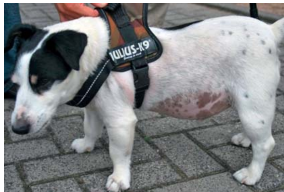
► Abb. 1 Neben der Hypotrichose fallen bei diesem Hund mit Hyperkortisolismus der Pendelbauch und der durchhängende Rücken auf.

Eine Schilddrüsenunterfunktion kommt vor allem bei Hunden vor. Schilddrüsenhormone werden vom Körper u. a. benötigt, um die Wachstumsphase des Haarfollikelzyklus in Gang zu bringen. Das Fell von Hunden mit einer Schilddrüsenunterfunktion verbleibt vermehrt im Ruhe- bzw. Ausfallstadium des Haarzyklus, ohne dass ein neues anagenes Haar nachgeschoben wird. Eine Alopezie in verschiedener Ausprägung, v. a. an Druckpunkten, am Schwanz (Rattenschwanz) und auf dem Nasenrücken ist