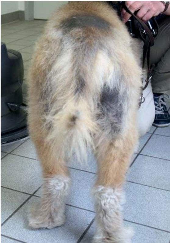
► Abb. 14 Wie bei anderen hormonellen Störungen sind Alopezie und Hyperpigmentation typisch für die Alopecia X. Der Haarzyklusarrest führt zuerst an Traktionspunkten wie dem Schwanzansatz bei Ringelschwanzrasen oder der Halsbandregion zu Alopezie. Diese breitet sich an den Seiten und der Rückenlinie weiter aus. Kopf und distale Gliedmaßen sind in der Regel nicht betroffen.