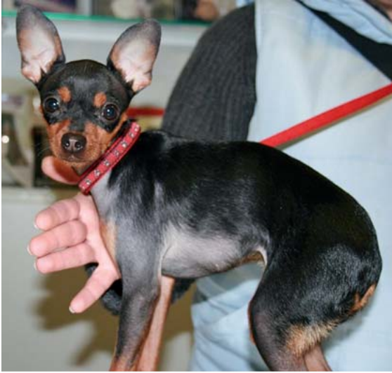
► Abb. 13 Ventrale Form der Schablonenkrankheit mit Alopezie vom Hals über die Brust bis zum Abdomen. Eine Form des androgenetischen Haarausfalls wird ursächlich vermutet.