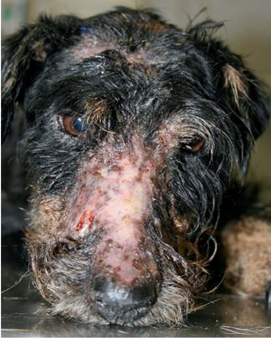
► Abb. 7 Oberflächliche nekrolytische Dermatitis: erosive, erythematöse, hyperkeratotische Hautveränderungen bei einem Terrier mit Glukagonom (Peptidhormon-produzierendem Pankreastumor).

gelbe Plaques und Papeln ab, die sich zu ulzerösen Knoten entwickeln und sich dann häufig sekundär infizieren. Die umgebende Haut ist meist erythematös und kann juckend und schmerzhaft sein. Typischerweise sind diese Läsionen an den Zehen und an Knochenvorsprüngen der Gliedmaßen, aber auch im Kopfbereich zu finden.