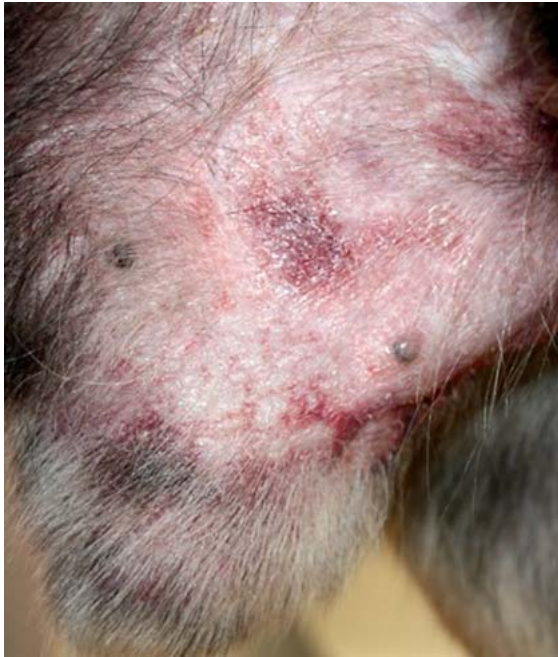
► Abb. 8 Schlaff hängendes Präputium und sekundäre Pyodermie bei einem Rüden mit Sertolizelltumor.