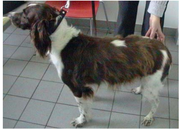
► Abb. 12 Kastrationsinduzierte Fellveränderungen bei der Hündin – sog. Wooly-Syndrom.

Hündinnen können nach der Kastration ein sog. „ Wooly-Syndrom “ entwickeln (► Abb. 12 ). Korrelierend zum LH-Level im Blut, der bei kastrierten Hündinnen ansteigt, zeigen diese Hündinnen eine erhöhte Anagen:Telogen-Ratio der Haarfollikel. Das Deckhaar am Körper wächst lang und ist im Farbton durch Ausbleichen heller als vor der Kastration. Bei manchen Hündinnen, gerade wenn diese eine Junghundvaginitis hatten und vor der 1. Läufigkeit kastriert wurden, können sich eine perivulväre Dermatitis und chronische Vaginitis entwickeln. Es wird spekuliert, ob ein Hypoöstrogenismus, ein erhöhter LH- oder GnRH-Spiegel bzw. eine Veränderung der Haarfollikelrezeptoren für LH, FSH und GnRH für diese Verände-