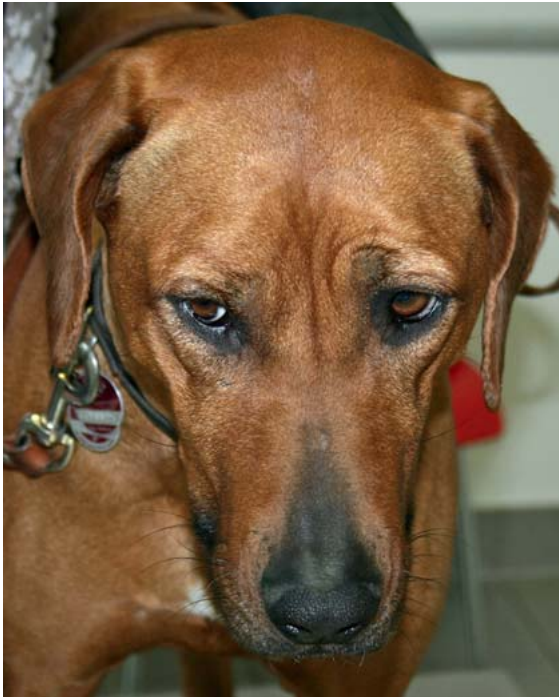
► Abb. 2 Rhodesian Ridgeback mit wiederkehrenden Pyodermien. Die Alopezie und Hyperpigmentation des Nasenrückens lassen eine Hypothyreose als Grunderkrankung vermuten, die die Hautimmunität herabsetzt.

die Folge (► Abb. 2 ). Das lang verbleibende telogene Haar bleicht häufig etwas aus und so kommt es oft zu Fellfarbveränderungen (schwarz zu braun etc.). Auch das Nachwachsen des Felles nach einer Rasur ist oft deutlich verzögert. Neben der Alopezie zeigen Patienten mit Hypothyreose aber auch oft noch andere systemische und dermatologische Auffälligkeiten. Sie neigen zu einer Gewichtszunahme und Leistungseinbußen .