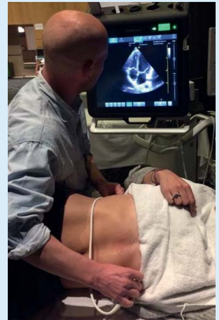
Et stemningsbilde fra en hands-on-sesjon for ultralyd i legevakt og akuttmottak.

Sesjonen hadde flere spennende foredrag med internasjonalt anerkjente forelesere.