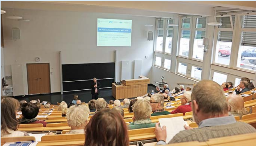
Patientenforum Lunge am 17.3.2018 in Dresden.