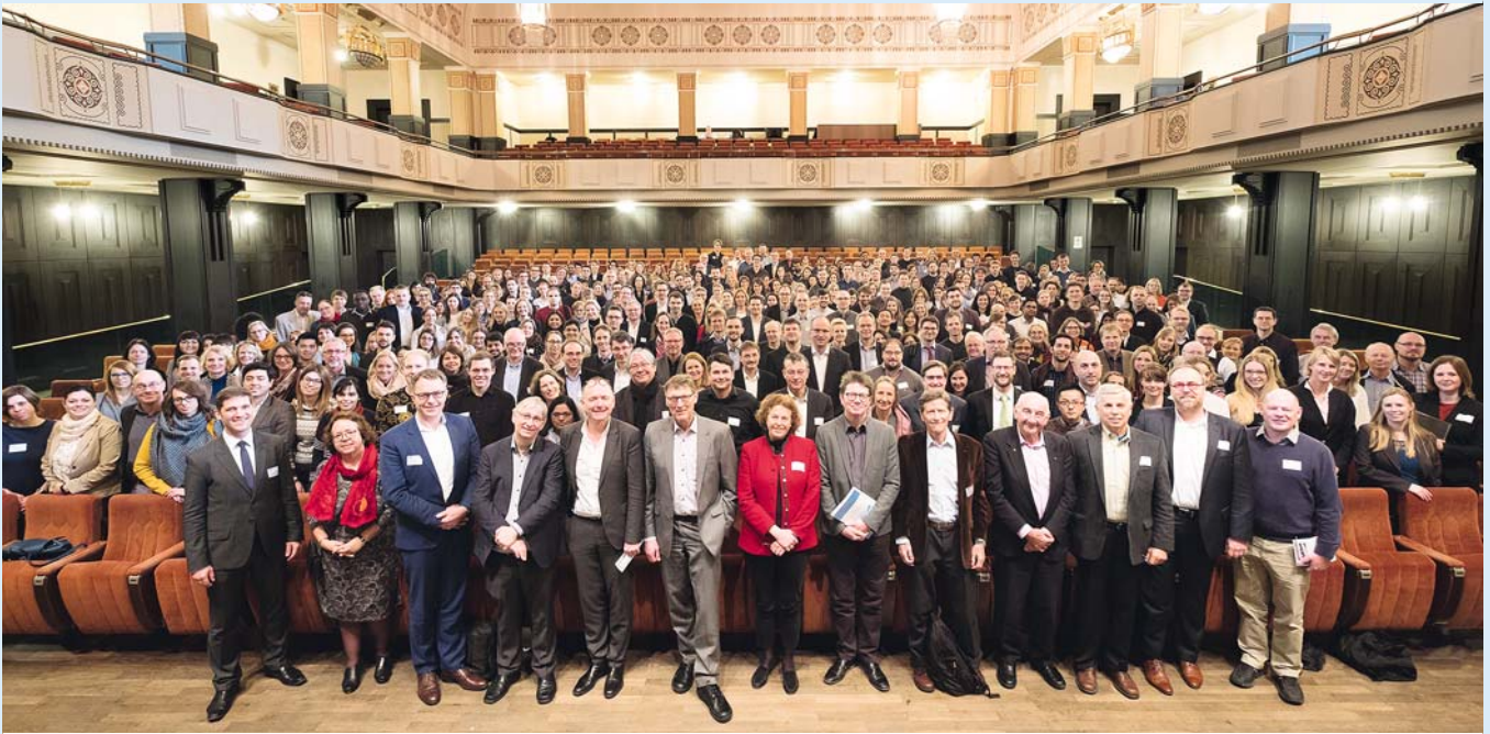
7. DZL-Jahrestreffen in Bad Nauheim.

Partner Lungeninformationsdienst hervor. Nach der Eingangsrede gaben leitende DZL-Wissenschaftler Überblicksvorträge zu ihren Krankheitsbereichen und Plattformen. Nachwuchswissenschaftler schlossen je mit einer kurzen Highlight-Präsentation an die Vorträge an. Von den rund 290 eingereichten Poster-Abstracts hatten Vertreter der Krankheitsbereiche zuvor den jeweils besten Beitrag für einen mündlichen Plenumsvortrag ausgewählt. Bei zwei längeren moderierten Postersessions hatten zahlreiche Nachwuchsforscher Gelegenheit, ihre Projekte vorzustellen. Das DZL verlieh abschließend insgesamt zehn Posterpreise.