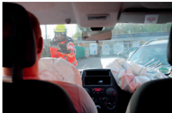
► Abb. 2 S – spricht der Patient? und „Traumahand“.