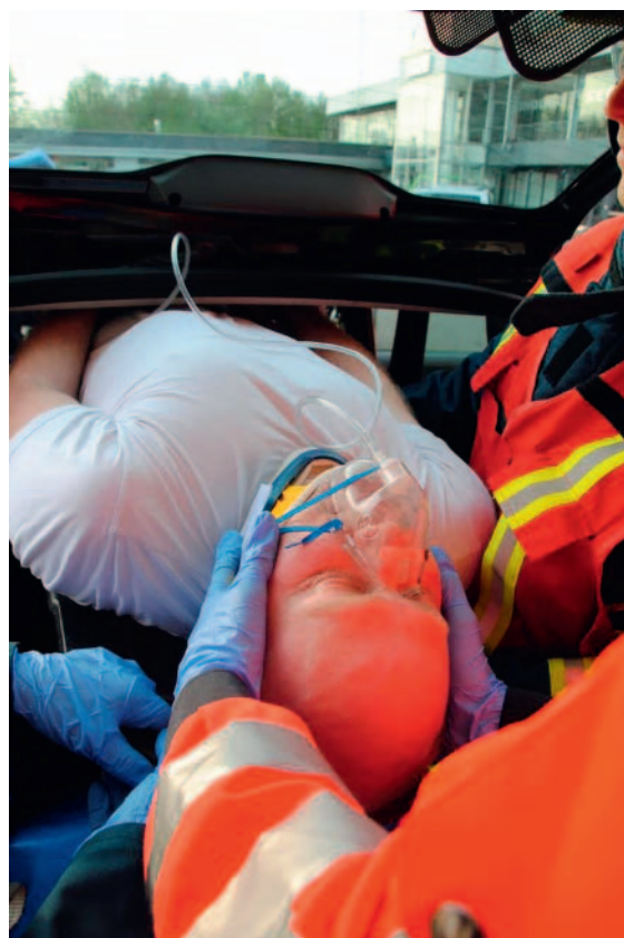
► Abb. 12 Manuelle Fixierung der Halswirbelsäule beim Bergen des Patienten durch die Heckklappe.