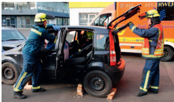
► Abb. 7 Einschieben des Spineboards.

Achten Sie dabei darauf, dass ein innerer Retter die Halswirbelsäule und den Kopf des Patienten zusätzlich ununterbrochen in Neutralstellung manuell fixiert (► Abb. 9 ).