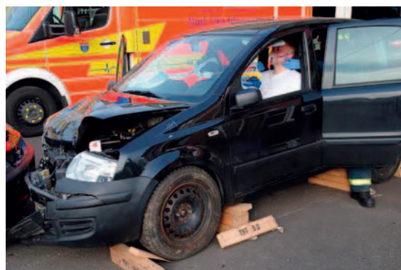
► Abb. 3 PKW-Sicherung/-Unterbauung