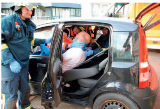
► Abb. 8 Ablegen des Patienten auf dem Spineboard.