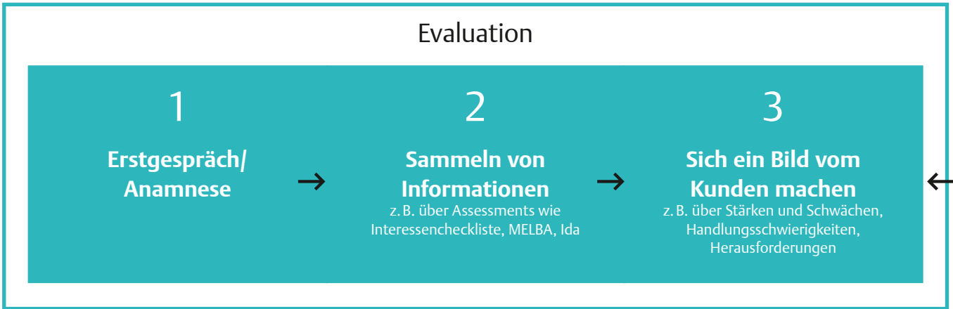
Prozessdarstellung einer Vermittlung von Rehabilitanden im Rahmen des Integrationsfachdienstes. Angelehnt an die 6 Schritte des Therapeutischen Reasoning von Kielhofner [2]. An Schritt 6 schließt sich wieder der 1. Schritt an.

Ablauf eines Auftrags „Vermittlung von Rehabilitanden“ → Wird man als Mitarbeiter des IFD damit beauftragt, einen Rehabilitanden zurück auf den allgemeinen Arbeitsmarkt zu vermitteln, kann der Ablauf hierfür, wie jede andere ergotherapeutische Behandlung, zum Beispiel in das Prozessmodell des Model of Human Occupation eingeordnet werden [2] (Abb.).