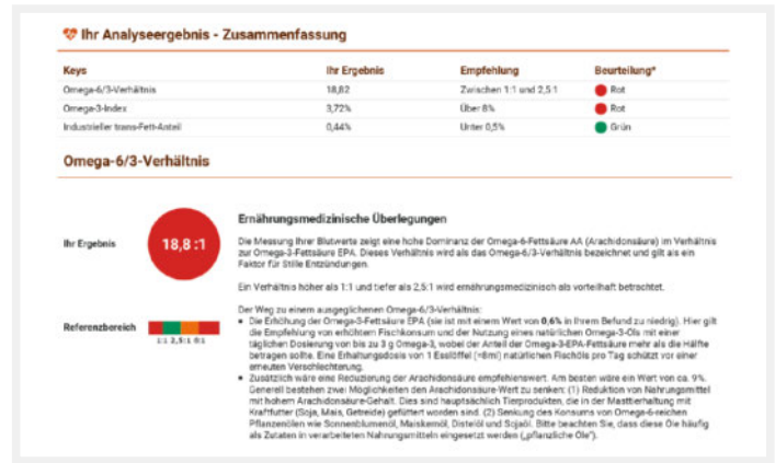
► Abb. 3 Hoher AA/EPA-Quotient von über 18 bei einer Patientin mit Multipler Sklerose.

Anmerkung des Autors: Ich zitiere ganz bewusst diese Studie, nicht weil sie beweist, dass Omega-3-Fettsäuren doch nicht anti-entzündlich wirken, sondern um aufzuzeigen, dass Studien klug konzipiert sein sollten. In dieser Studie hatten die Probanden einen CRP-Ausgangswert von 0,78 mg/dl, sie waren also völlig entzündungsfrei, ja sie hatten noch nicht einmal Hinweise auf eine stille Entzündung. Was soll denn da noch gesenkt werden? Der zweite gravierende Fehler: Als „Placebo“ wurde ein Olivenöl