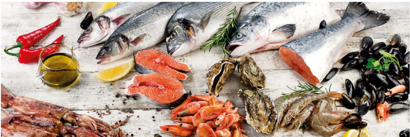
► Abb. 1 Fettreiche Kaltwasserfische gehören zu den besten Nahrungsquellen für Omega-3-Fettsäuren.

Silent inflammation, low-grade inflammation, omega-3 fatty acids