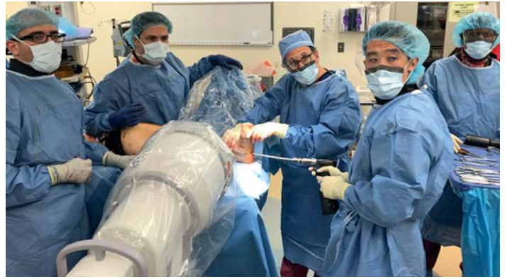
► Abb. 3 Im OP.

DOI https://doi.org/10.1055/a-0647-2582 OP-JOURNAL 2018; 34: 184–185 © Georg Thieme Verlag KG Stuttgart · New York ISSN 0178-1715