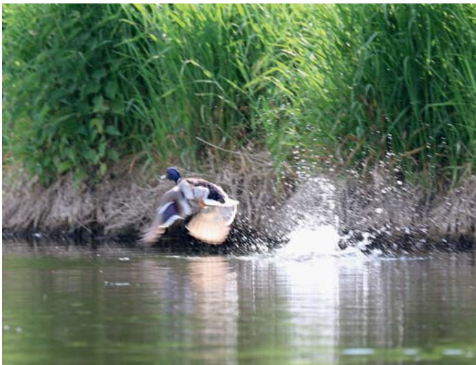
► Abb. 1 Staunen wir noch über uns vermeintlich bekannte Phänomene und fragen uns, wie es eigentlich sein kann, dass so etwas passiert? Wieso fliegt die Ente und kann aus dem Wasser starten? Oder wie können Kinder geboren werden? Wissen wir das wirklich?

In den Anfängen der Osteopathie in Deutschland gab es am Übergang von den 1980er- in die 1990er-Jahre eine Atmosphäre der Begeisterung für die Osteopathie, die mit reichlich Humor gespickt war. Wir brannten regelrecht und überschlugen uns im Interesse für diese besondere Methode, was das Lernen befeuerte und eigene Kreativität anregte. Es gab noch keine deutschsprachige Literatur – nur mündliche „Überlieferungen“ und wilde Sammlungen von Fotokopien. Der Anteil der praktischen Arbeit war sicher auch unstrukturierter und weniger differenziert als heute. Alles in allem gab es in den Schulen noch kein echtes didaktisches Konzept, sondern ein reichlich verworrenes Durcheinander. Auf den Postgraduate-Fortbildungen trafen sich viele interessante Persönlichkeiten, Originale, die keinen trockenen Stoff, sondern lebendige Osteopathie lehren oder lernen wollten. Abends feierten, musizierten und tanzten wir gemeinsam.