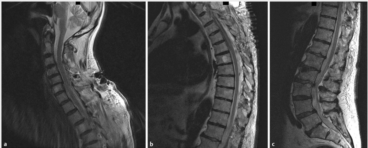
► Abb. 2 MRT postoperativ, T2-Sequenz (16.05.2018).

chirurgischen, mikroskopisch assistierten Dekompression neben der Spülung mit isotonischen Lösungen, über mehrere Spritzen mit aufgesetzten Knopfkanülen insgesamt 90 mg rt-PA, verteilt über alle eröffneten Fenster (abzüglich möglicher Verluste bei Applikation und gleichzeitig verwendeter Absaugung – ca. 3–4 mg pro Dekofenster) ausgiebig verteilt und eine Umspülung des Duraschlauchs der nach cranial und caudal anliegenden Segmente durchgeführt. Bei zunächst vollständiger Remission bereits nach einer Stunde postoperativ, zeigte sich