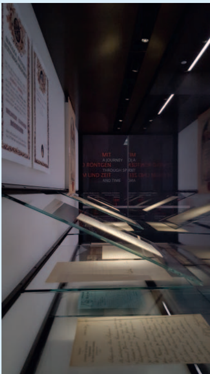
In der Schatzkammer können die Besucherinnen und Besucher Originaldokumente, z. B. Briefe an Röntgen von herausragenden Persönlichkeiten, entdecken.