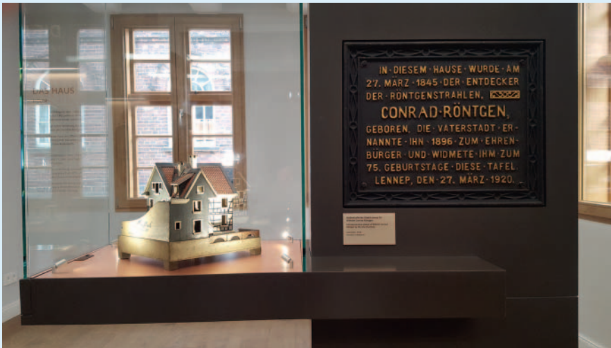
Die Ausstellung zeigt auch ein historisches Modell des Geburtshauses von Wilhelm Conrad Röntgen, sowie eine Originalplakette von 1920.