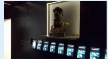
Per Tablet lässt sich mehr über die Originaldokumente erfahren.

Getragen, begleitet und finanziert wird das Geburtshaus von den Mitgliedern der DRG sowie zahlreichen Bürgerinnen und Bürgern und Unternehmen aus der Region. Zu den rund 200 Partnern, Förderern und Spendern gehören u. a. Bracco Imaging Deutschland,