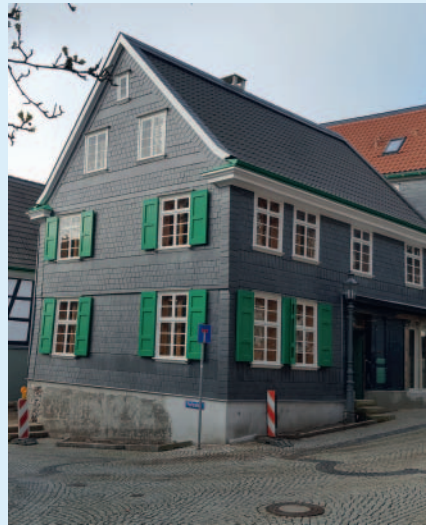
Das Röntgen-Geburtshaus in Remscheid-Lennep – mit neuen Fenstern und neuer Fassade.

Die neue Publikumsausstellung im Röntgen-Geburtshaus, die maßgeblich von der NRW-Stiftung und dem Landschaftsverband Rheinland mitfinanziert wurde, widmet sich ganz der Person Röntgens und seiner Lebensleistung. Sie zeigt Stationen von seiner Geburt und seiner Familie in der bergischen Stadt Lennep, über seine Schulzeit, sein Studium bis hin zu seinen beruflichen Stationen in Gießen, Würzburg und München. Den Besucherinnen und Besuchern wird, angelehnt an die ursprüngliche Raumaufteilung um 1840, ein Rundgang durch vier Ausstellungsräume rund um das zentrale Treppenhaus ermöglicht. Sie können dabei die Geschichte dieses besonderen Hauses mit dem Wandel seiner Funktion und Nutzung im Laufe der Zeit nachvollziehen, die weltweiten Netzwerke Röntgens ergründen und sich in einer Schatzkammer auf Spurensuche mit Objekten aus seinem Nachlass begeben. Das Deutsche Röntgen-Museum stellt hierfür aus seinen Archiven eine Auswahl besonderer Dokumente, Urkunden und Briefe zur Verfügung. Virtuelle Medien erlauben zudem einfach und anschaulich den Einblick in zahlreiche weitere, vornehmlich handgeschriebene Doku-