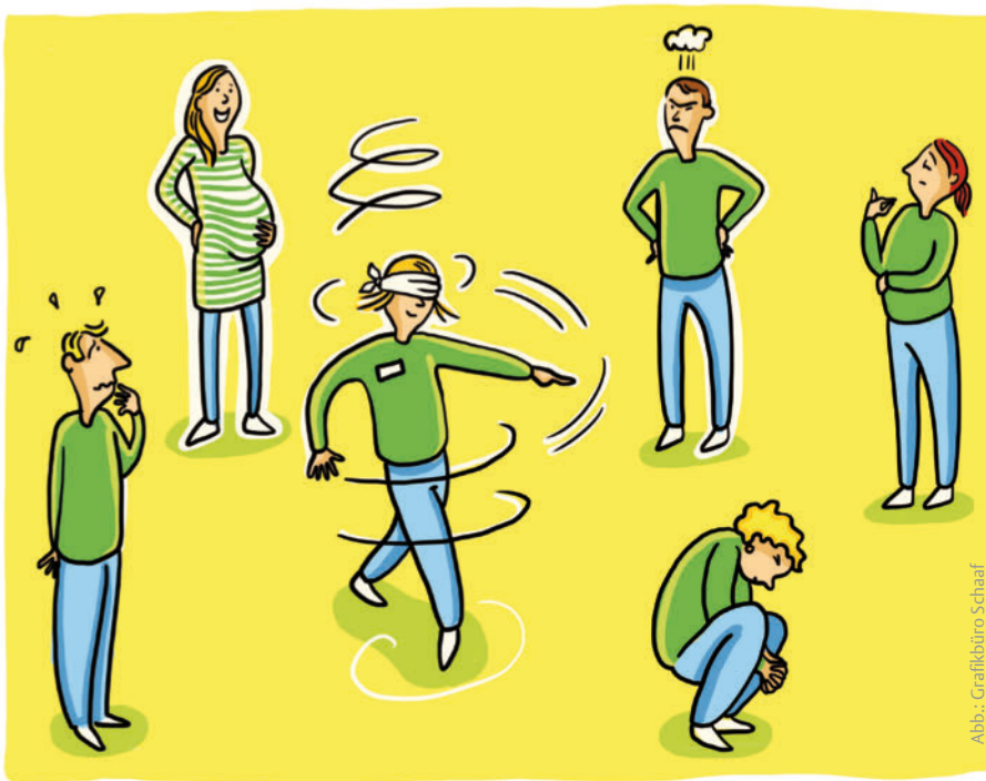
Abb.: Grafikbüro Schaaf

Unbeliebte Aufgaben verteilen Nicht immer findet sich für jede Aufgabe bereitwillig jemand aus dem Team, der sie übernimmt. Was nun? Als Chefin entscheiden? Es selbst übernehmen? Es gibt noch einen anderen Weg, bei dem alle mit der Entscheidung zufrieden sein werden, wie unattraktiv die Aufgabe auch sein mag – versprochen!