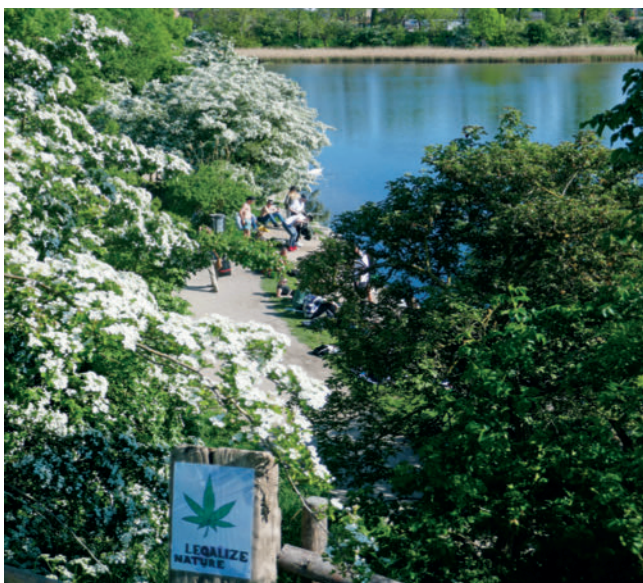
► Abb. 4 Nur wenige Meter von den Verkaufsständen entfernt wird es ruhig und die Christiania fühlt sich – fast (vgl. das Hinweisschild im Vordergrund) – an wie eine Parkanlage.

hagens. Sie wird von vielen Dänen als Symbol und Inbegriff für den eigenen freien Lebensstil gesehen, auch von Institutionen, Organisationen und Unternehmen: Wer seinen ausländischen Gästen etwas „typisch Dänisches“ bieten will, der geht mit ihnen in die Christiania! – Nicht anders erging es mir ja auch. Und mein Gastgeber, ein deutscher Student der Astrophysik, der seit 2 Jahren dort lebt, zeigte und erklärte mir die Christiania mit Stolz und Begeisterung, was ich beim Anblick der sehr vielen Menschen, die beim Bier oder einer Rauchware (was auch immer) nahezu wie auf einem Jahrmarkt sich unterhielten, gut nachvollziehen konnte. Hier wird seit einem knappen halben Jahrhundert ein soziales Experiment gelebt!