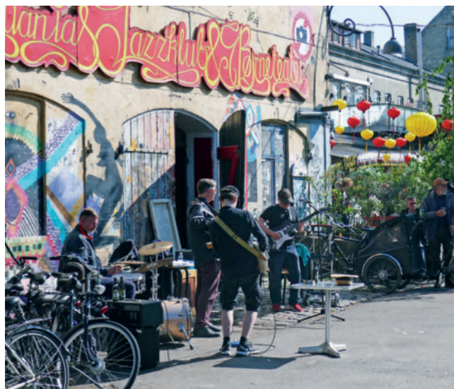
► Abb. 3 Straßenecke zur Pusher-Street im Hintergrund. An der Hauswand im Hintergrund das Zeichen für „Fotografieren verboten“. Darunter die gelben und roten Lampions, die anzeigen, dass weiche Drogen verkauft werden. In den Seitenstraßen geht es hingegen ganz normal zu, mit Musik (eine ältere Rock-Band), kleinen Läden, Essen und (vor allem Bier) Trinken.

Über Jahrzehnte war unklar, was geschehen sollte. Mehrere Versuche der Räumung scheiterten am Widerstand der einigen hundert Bewohner. Gemäß einer Übereinkunft mit dem dänischen Verteidigungsministerium bezahlen sie seit dem Jahr 1995 Steu-