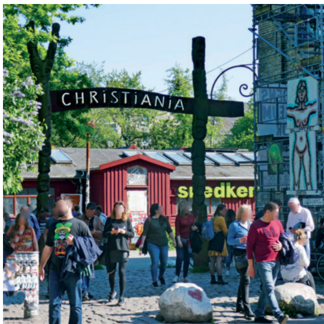
► Abb. 1 Der Eingang der „Freistadt Christiania“ ist mittlerweile weltbekannt.