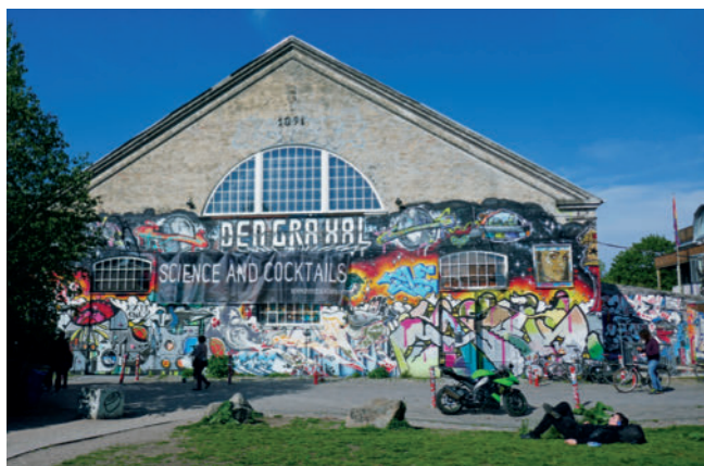
► Abb. 7 Die „graue Halle“, der große Veranstaltungsraum der Christiania mit Platz für über 1000 Besucher, ist mittlerweile längst nicht mehr ganz so grau wie früher.