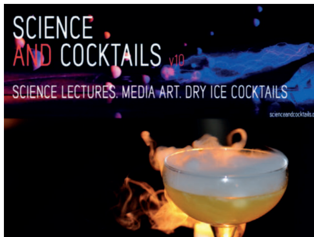
► Abb. 5 Abbildungen, die man auf der Webseite von Science & Cocktails findet, und deren grafische Gestaltung dessen Grundgedanken vielleicht besser verdeutlichen können als viele Worte ( http://www.scienceandcocktails.org/ ). Nebenbei bemerkt: Trockeneis ist nichts anderes als sehr kaltes (tiefer als -78,48^{\circ}\text{C} gekühltes) Kohlendioxid ( \text{CO}_2 ), das bei normalem Luftdruck bei -78,48^{\circ}\text{C} direkt vom Feststoff in die Gasphase übergeht, also ohne vorher zu schmelzen. Wirft man ein etwa Würfelzucker-großes Stückchen in eine wässrige Flüssigkeit (Cocktail), sprudelt sehr viel kaltes, mit Wasserdampf gesättigtes Gas, und es entsteht Nebel (Quelle: http://www.scienceandcocktails.org/ ).

„Science & Cocktails ist eine Initiative, die Wissenschaft und Unterhaltung durch die Schaffung einer Reihe von öffentlichen Vorlesungen inmitten von Musik, Kunst und einem nebligen, mit Trockeneis gekühlten Cocktail in der Hand einander näherbringen wollen. Im Allgemeinen werden wissenschaftliche Erkenntnisse für die meisten Menschen als unzugänglich betrachtet, sodass sie wie jede andere Information auch vom Forscher zum Journalisten und weiter über die Kanäle der Medien verbreitet und dabei vielleicht etwas verdreht werden. [...] Nach unserer Überzeugung fehlt im städtischen Raum eine Nachtkultur, die sich aus Wissen, Diskussion und Unterhaltung entwickelt. Wir betrachten den wissenschaftlichen Ansatz nicht allein als Informationsgewinn, sondern auch als Inspiration für Musik und Kunst und als ein Werkzeug beim Mixen