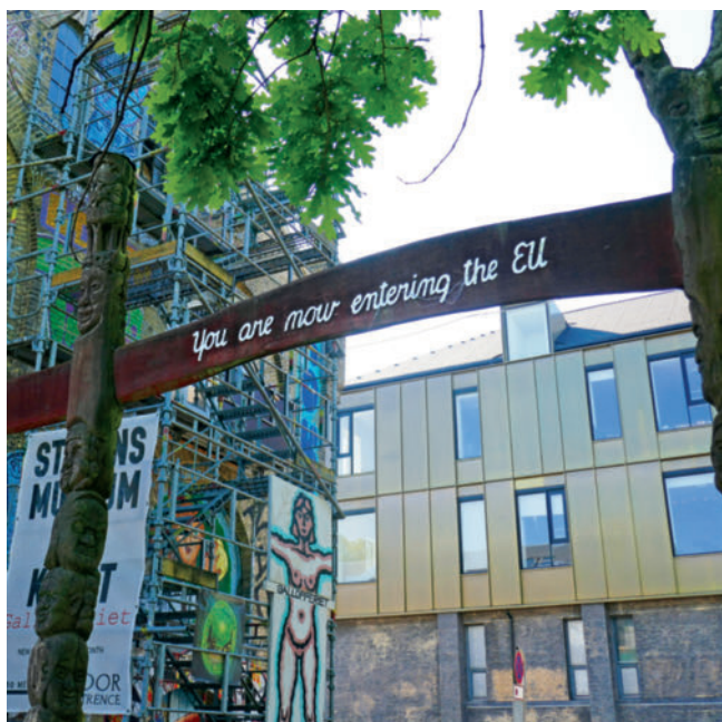
► Abb. 2 Die Rückseite des Eingangsschildes macht deutlich, dass man die Freistadt wieder verlässt und die EU betritt. Auch die Lage der Christiania inmitten unspektakulärer städtischer Bebauung wird deutlich.

streben, unerschütterlich in unserer Überzeugung zu sein, dass psychologische und physische Armut verhindert werden kann.“