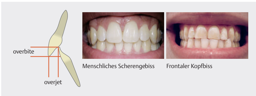
► Abb. 1 Schema zur Verdeutlichung des normalen Überbisses beim Menschen, der eine vertikale Komponente (overbite) und eine horizontale Komponente (overjet) hat (links), was zusammen das für den Menschen normale Scherengebiss ausmacht (Mitte). Liegt der Überbiss sowohl in der Horizontalen wie in der Vertikalen bei Null, stehen die Kiefer also direkt aufeinander, spricht man von einem Kopfbiss oder Tête-a-tête-Biss (engl.: „edge-to-edge“; rechts).

beißen der Zähne stehen nun die Schneidezähne direkt übereinander. Funde aus der Steinzeit von Schädeln erwachsener Menschen zeigen genau diese Stellung der Zähne als Ergebnis von Abschleifen und langsamer Dynamik (Wachstum, Wanderung, Stellungsänderung).