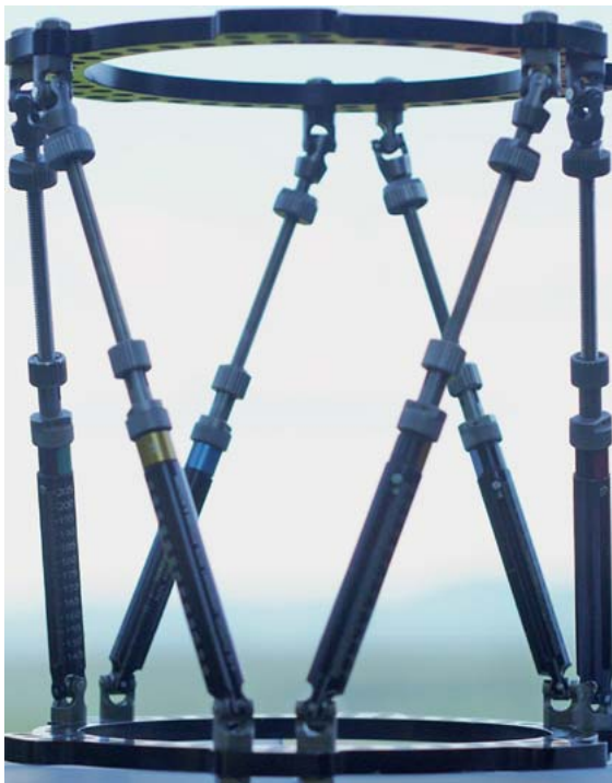
► Abb. 1 Das Hexapod mit den 6 Beinen macht jede Bewegungsmöglichkeit in 6 Freiheitsgraden möglich. Das technische System gibt es in jedem Flugsimulator und Fahrsimulator und für die orthopädischen Korrekturoperationen.

Ein jetzt von uns im Grundsockel eingebauter Hexapod (► Abb. 1 ) verlängert den Wolkenkratzer im Sinne einer Sky-Scraper-Distraktion (SSD) (► Abb. 2 ). Statt einfacher Verlängerung hilft der Hexapod (► Abb. 1, 2 ), jedwede Abweichung auszugleichen.