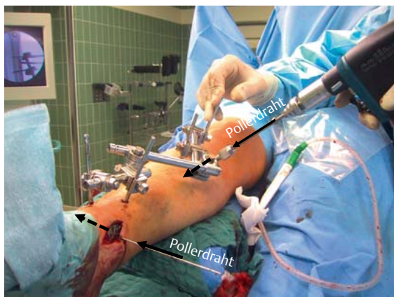
► Abb. 1 Ein ventral am Tibiaschaft eingebrachter Kirschner-Draht führt die eingeschobene Platte in der Mittellinie und verhindert die drohende Abweichung nach ventral.

„Pollerdrähte“ (► Abb. 1 und 2 ) können sehr gut helfen und sind ganz einfach, ohne Aufwand und ohne Komplikationsgefahr einzusetzen. Am Schaft, wo die Platte nicht abweichen soll, einfach über eine nur angestochene Stichinzision einen Kirschner-Draht platzieren (► Abb. 1 ). Dann kann die Platte wie von einer Leitplanke geführt werden und bleibt in der Mittellinie. Ein Pollerdraht im Bereich des Einschiebens kann verhindern, dass am Ende die Platte nach dorsal oder ventral rutscht (► Abb. 2 ).