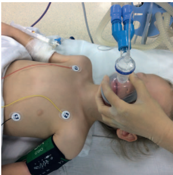
► Abb. 5 Die Auswahl der geeigneten Gesichtsmaske erfolgt altersabhängig. Bei Früh- bzw. Neugeborenen eignen sich v. a. runde, durchsichtige Gesichtsmasken aus Silikon, bei Säuglingen auch ovale Masken. Wichtig bei der Auswahl der geeigneten Maske ist, dass diese dicht sitzend Mund- und Nasenöffnung umschließt, ohne über Kinn- und Augenbereich hinauszuragen.