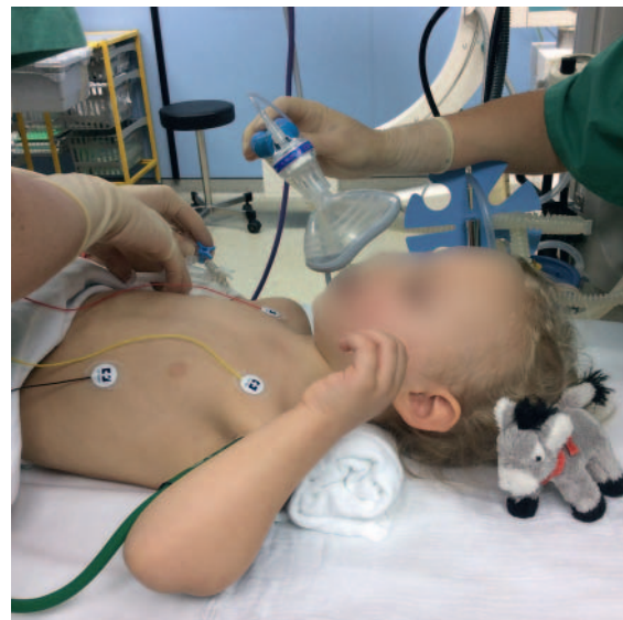
► Abb. 1 Bei kleinen Kindern gelingt die Sauerstoffapplikation am besten mit vorgehaltener Sauerstoffmaske bei hohem Frischgasfluss. Bei größeren, kooperativen Kindern können Masken mit Reservoirbeutel die inspiratorische Sauerstoffkonzentration zusätzlich erhöhen.

Atemwegsmanagement bei Kindern kann auch bedeuten, sich in Zurückhaltung zu üben. Vor allem bei erhaltenen Schutzreflexen und vorhandener Spontanatmung kann man bei Bedarf auch bei Kindern ausschließlich großzügig Sauerstoff applizieren, um eine Hypoxämie zu vermeiden.