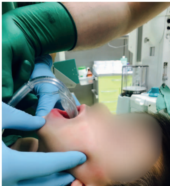
► Abb. 7 Die Auswahl der geeigneten LM erfolgt gewichts- bzw. größenabhängig (► Tab. 2 ). Zur Platzierung wird die LM entblockt und entlang des harten Gaumens vorgeschoben. Dafür wird der Kopf des Kindes mittels Nackenrolle und Positionierung in Neutralposition gelagert. Eine Unterkieferprotrusion mit gleichzeitiger Mundöffnung erleichtert die Insertion.

Die meisten Hersteller von SGA bieten mittlerweile Modelle an, die einen Drainagekanal integriert haben. Diese sog. SGA der 2. Generation ermöglichen somit eine zuverlässige Trennung von Gastrointestinal- und Respirationsstrakt. Vor allem für die Notfallversorgung erscheint dies sinnvoll, da gastrale Sekrete und Luft nicht nur passiv über den Drainagekanal abfließen können, sondern sich durch die Insertion einer Magensonde auch aktiv evakuieren lassen. Das Konzept der LM zur Verwendung bei Kindern unterscheidet sich nicht von dem zur Verwendung bei Erwachsenen. Weiterführende Informationen zu Anwendung und Funktion von LM der 2. Generation finden sich auch bei [8, 9].