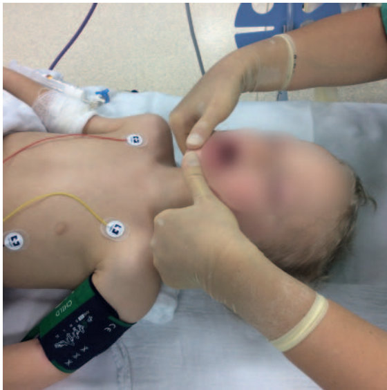
► Abb. 4 Bei nicht mehr suffizienter Spontanatmung ist der sofortige Beginn der Beatmung mittels Gesichtsmaske indiziert, um eine Hypoxämie und deren kardiale Folgen zu vermeiden. Mittels Protrusion wird nun der Unterkiefer nach vorne gezogen und der Mund gleichzeitig geöffnet. Dabei ist darauf zu achten, dass die Zunge nicht oben am Gaumen anliegt, sondern nach unten fällt und im Unterkiefer zu liegen kommt – dann erst erfolgt das Aufsetzen der Maske. Eine durchsichtige Gesichtsmaske hilft dabei, während der Maskenbeatmung ein kontinuierliches optisches Feedback der korrekten Position zu erhalten.