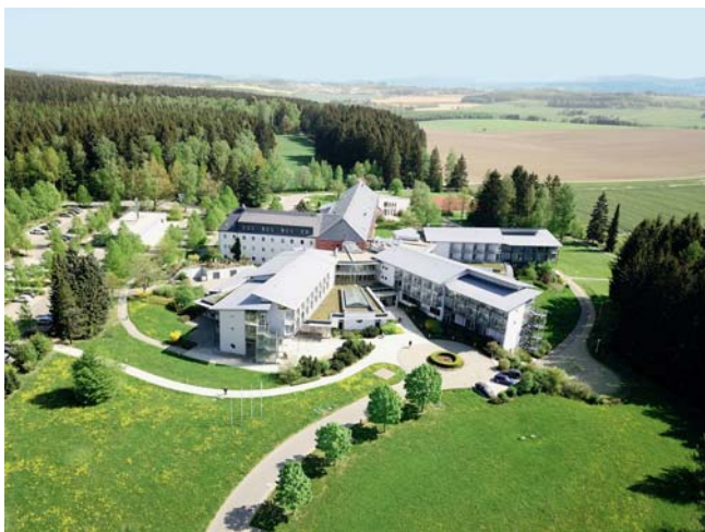
► Abb. 1 BG Klinik Falkenstein – Flugansicht (Quelle: Jan Voigt/BG Klinik Falkenstein).

einer eigenständig Chefarzt-geführten Abteilung für Berufsdermatologie. Mit insgesamt 11 dermatologischen Patientenbetten stand zunächst eine ausreichend große Kapazität für die Behandlung hafterkrankter Patienten zur Verfügung. Durch bauliche Maßnahmen wurden gesonderte Patienten- und Behandlungsräume geschaffen, auch wurde die apparative Ausstattung optimiert. Studienkonform erfolgt seitdem die Patientenbetreuung durch Fachärzte für Dermatologie mit der Zusatzbezeichnung Allergologie und der Zertifizierung Berufsdermatologie sowie durch in der Behandlung von Berufsdermatosen geschulte Pflegekräfte.