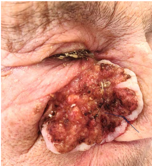
► Abb. 3 Fortgeschrittenes Plattenepithelkarzinom.

Zunahme der epithelialen Hauttumoren um mehr als das Doppelte und das Vorliegen von „weißem Hautkrebs“ bei jedem 10. Patienten des gesetzlichen Screenings. Hier zeigt sich ein enormes, drohendes Risiko der Zunahme von epithelialen Tumoren und ihren Vorstufen in den nächsten Jahren, das sicherlich Auswirkungen auf unser Gesundheitssystem haben wird. Ohne rechtzeitige Intervention, sei es operativ oder mit anderen Methoden wie der photodynamischen Therapie, Imiquimod oder Ingenolmebutat, wird diese Zunahme in naher Zukunft im nördlichen Europa ein ernst zu nehmendes Problem der Versorgung der Bevölkerung darstellen.