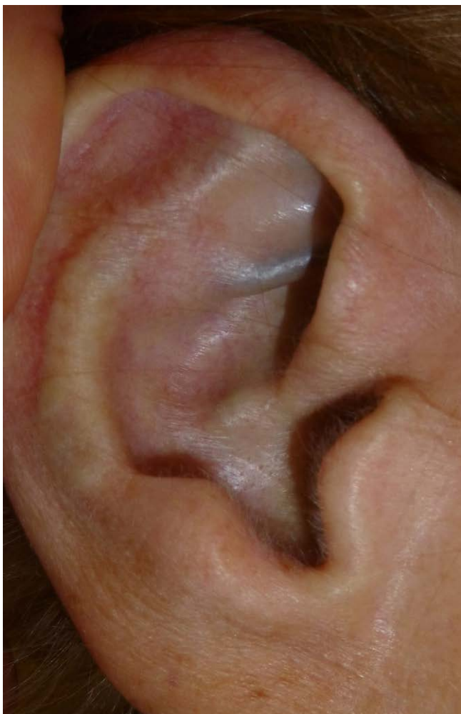
► Abb. 3 HGA-Ablagerungen am Ohrknorpel