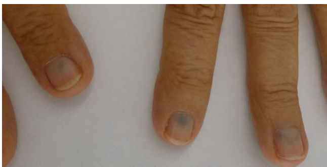
► Abb. 4 HGA-Ablagerungen an den Fingernägeln.

zymhemmung kommt es zu einer erheblichen Erhöhung der Tyrosinkonzentration im Blut. Nitison ist aktuell nicht für die Behandlung der Alkaptonurie zugelassen. Tierversuche zeigen bei frühzeitigem Einsatz erniedrigte HGA-Serumspiegel und deutlich weniger Pigmentablagerungen im Gewebe [13].