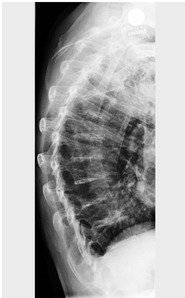
► Abb. 5 Röntgen der Brustwirbelsäule seitlich. Typisches Bild einer Ochronose mit ausgeprägten Verkalkungen der Bandscheiben und ausgeprägten multisegmentalen degenerativen Wirbelsäulenveränderungen.

Eine prospektive Studie mit 40 Patienten aus dem Jahr 2011 hatte zwar eine starke Reduktion der HGA im Urin und Serum ge-