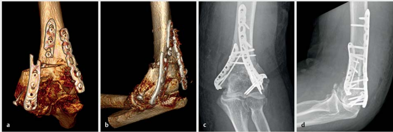
► Abb. 6 53-jähriger Patient mit posttraumatischer Arthrose nach Abriss des Epicondylus radialis humeri im Kindesalter. Auswärtige Versorgung mittels suprakondylärer Umstellungsosteotomie und Doppelplattenosteosynthese. Wenige Wochen postoperativ kam es zum Plattenbruch, am ehesten aufgrund der auf gleicher Höhe endenden Platten (a, b). Revision mittels anatomischer Reposition und winkelstabiler Doppelplattenosteosynthese, wobei beide Platten auf unterschiedlichen Höhen enden, um den biomechanischen Stress hier zu vermindern.

Studienergebnissen zeigte die Versorgung mittels Ellenbogenendoprothese mit einem Follow-up von 2 Jahren eine geringere Reoperationsrate mit einem besser vorhersagbaren Outcome [28]. Rajaei et al. wiesen auf eine signifikante Zunahme der endoprothetischen Versorgung für die letzten 10 Jahre für Patienten älter als 65 Jahre hin [29]. Aufgrund der Frakturmorphologie des distalen Humerus, welche die Bandansätze an den Epikondylen häufig inkludiert, führt die Wahl des Prothesendesign mehr zu Semiconstrained/Constrained Prothesen, da die Hemiprothesen eine aufwendige Rekonstruktion voraussetzen.