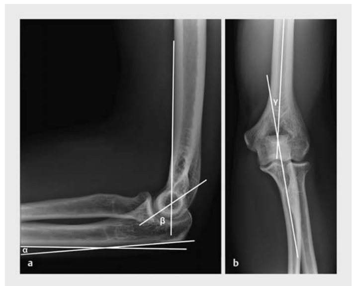
► Abb. 3 Ellenbogengelenk seitlich und a.–p. Im seitlichen Röntgenbild ist zum einen mit \alpha der PUDA-Winkel (PUDA = proximal ulna dorsal angulation) und andererseits mit \beta die anteriore Angulation des Capitulum eingezeichnet. Im a.–p. Röntgenbild ist der Cubitus-Valgus-Winkel (engl. carrying angle) mit \gamma eingezeichnet. Die Rekonstruktion dieser Landmarks ist insbesondere im Revisionsfall wichtig, bei unilateraler Verletzung sollten vergleichende Röntgenbilder der Gegenseite angefertigt werden.