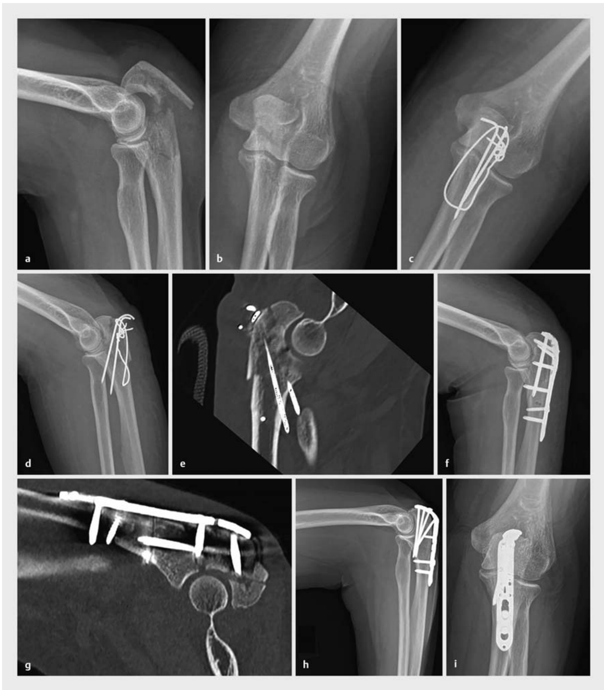
► Abb. 5 Fall einer 70-jährigen Patientin, die initial in einer auswärtigen Klinik bei instabiler und multifragmentärer Olekranonfraktur mittels Zuggurtungsosteosynthese versorgt wurde. Im postoperativen Röntgen sowie CT zeigte sich eine insuffiziente Versorgung mit sekundärer Dislokation, sodass in derselben Klinik auf eine Plattenosteosynthese gewechselt wurde. Auch hier zeigte sich eine insuffiziente anatomische Reposition, proximal der Fraktur waren die Schrauben ausschließlich monokortikal besetzt. Zudem war ein proximales Fragment nicht gefasst (a–g). Wir revidierten die Fraktur in unserer Klinik mittels anatomischer Reposition und winkelstabiler Plattenosteosynthese in Kombination mit einer interfragmentären Zugschraube. Das proximale Fragment wurde dabei mitgefasst und die Schrauben bikortikal aufsteigend subchondral besetzt (h,i).