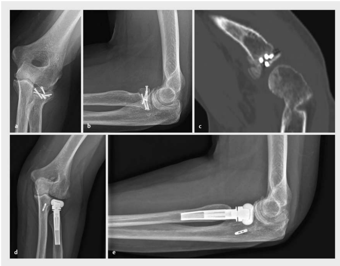
► Abb. 4 Zustand nach auswärtiger Schraubenosteosynthese einer vollständig intraartikulären Mason-3-Fraktur einer 53-jährigen Patientin. Im Verlauf zeigte sich nach 8 Monaten eine Pseudarthrose mit Osteosyntheseversagen, intraartikulärer Schraubenlage und Nekrose des Radiuskopfes (a–c). Zudem lag eine traumatische und mittlerweile chronische Insuffizienz des lateralen ulnaren Bandapparates vor. Durch eine Staging-Arthroskopie konnte eine Infektion ausgeschlossen werden. 10 Monate nach Trauma erfolgte der Revisionseingriff mit Implantation einer Radiuskopfprothese (Typ Mopyc, Fa. Tornier) sowie Rekonstruktion des LUCL mit Fascia lata in modifizierter Jobe-Technik (ulnar Endobutton, humeral Sviwelock 4.75) (d,e).

sionsfall, ist auf die korrekte Reposition der Ulnafraktur zu achten. Bei Bado-Typ-I-Verletzungen kommt es korrespondierend zur anterioren Luxation des Radiuskopfes zu einer dorsalen Angulation der Ulna. Wird der PUDA-Winkel nicht korrekt rekonstruiert (► Abb. 3 ), kann sich eine chronische Instabilität im Humeroradialgelenk entwickeln. Bei Bado-Typ-II-Verletzungen kommt es entsprechend der posterioren Radiuskopffluxation zu einer ventralen Angulation der Ulna, die entsprechend korrigiert werden muss [8]. Neben der Achskorrektur im seitlichen Alignment, ist weiterhin eine radiale Plattenanlage zu vermeiden. Dies führt neben der Verstärkung des Bowing-Effektes auch zu einer Einschränkung der Umwendbewegung. Bei Osteosyntheseversagen bzw. fehlender knöcherner Konsolidierung ist die Lösung häufig die Revision mittels Reosteosynthese unter Verwendung von Auto- bzw. Allografts.