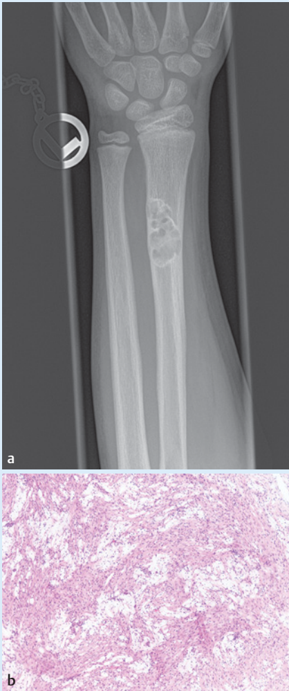
► Abb. 1 Nicht ossifizierendes Knochenfibrom des distalen Radius mit traubenförmiger und randsklerosierter Osteolyse (a). Die Histologie zeigt storiforme Spindelzellproliferate ohne zelluläre Atypien und ausgedehnte Schaumzellakkumulationen (b).

venösen Malformationen des Gehirns und in benignen Endometrioseherden [2, 3]. Der Nachweis entsprechender Mutationen in NOF (gesamthaft in 48 von 59 untersuchten NOF, 81,4%) kann als Argument dafür gewertet werden, dass es sich doch um echte Neoplasien handelt. Außerdem passt das gehäufte Vorkommen im Rahmen der Neurofibromatose Typ 1 dazu, dass NOF zum Spektrum von Erkrankungen zählen, die mit Mutationen im MAP-Kinase Signalweg einhergehen (sog. RASopathien). Der selbstlimitierende Verlauf der Läsionen bleibt pathogenetisch ungeklärt. Möglicherweise kommt es im Verlauf zu einem Ausdünnen der mutationstragenden Zellen durch Apoptose, wie es z.B. auch bei der fibrösen