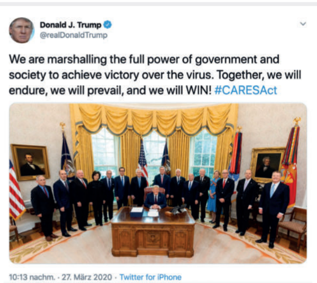
► Abb. 4 Zitat aus einem Tweet

Es ist daher schade, dass der Präsident des Landes, das schon länger die Liste der am meisten betroffenen Länder anführt, weder das Tragen von Masken („das ist nichts für mich“) noch die körperliche Distanzierung vorlebt. Er wird mit seinem Motto „America first“ wohl kaum die Position der USA auf der Liste der Infektionszahlen gemeint haben.