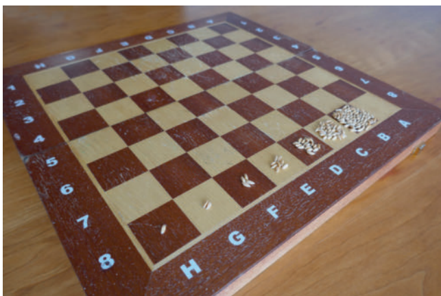
► Abb. 1 Weizenkörner auf einem Schachbrett. Beginnt man mit 1 Korn auf dem ersten Feld und verdoppelt die Zahl auf dem nächsten Feld usw. nimmt die Zahl der Körner exponentiell zu und schon auf das achte Feld passen die Körner nicht mehr: 1, 2, 4, 8, 16 etc., die Zahl der Körner folgt also der Formel 2^{(n-1)} , wobei n die „Nummer des Feldes ist. Folglich befinden sich auf dem ersten Feld 2^{0=1} , auf dem zweiten Feld 2^{1=2} , auf dem dritten Feld 2^{2=4} und auf dem 64. Feld 2^{63} Körner

ten Tag vier usw. Am dreißigsten Tag ist der ganze See bedeckt mit Seerosen. Wie bedeckt war der See einen Tag zuvor?