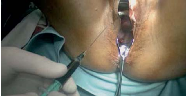
► Abb. 1 Präoperative Injektion von Patentblau (intrazervikal).

gativem Befund in der HE-Färbung, erfolgt eine zusätzliche Untersuchung mittels IHC unter Verwendung der Pan-Zytokeratinantikörpern AE1 und/oder AE3. Auf diese Weise werden Metastasen bis zu einer Größe von nur 100 \mu\text{M} mit einer Sensitivität von 70% detektiert [40]. Als indirekte Marker für eine HPV-Ätiologie können ergänzende Antikörper auf p16 eingesetzt werden [5].