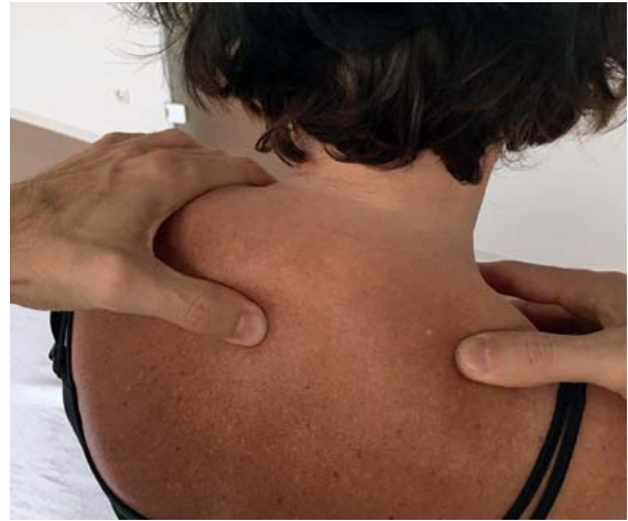
► Abb. 4 Behandlung der 1. Rippe nach Sutherland. Der linke Daumen hakt von links an den Proc. spinosus an und der rechte Daumen nimmt Kontakt mit der 1. Rippe unterhalb des M. trapezius auf.