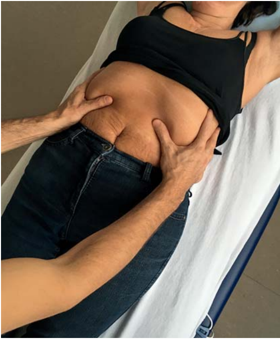
► Abb. 5 Behandlungstechnik zur Kuppelbildung des Diaphragma abdominale. Der Thorax wird in Expirationsposition begleitet.