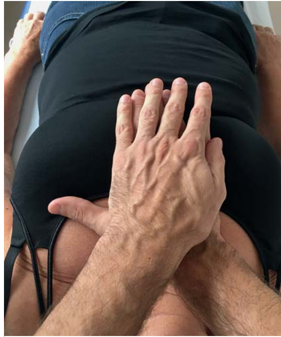
► Abb. 6 Lymphpumpe. Während der Expiration begleitet man das Sternum nach posterior-inferior, um es dann plötzlich loszulassen.

seine abdominale Masse das Centrum tendineum nach oben und dehnt das Diaphragma abdominale noch mehr.