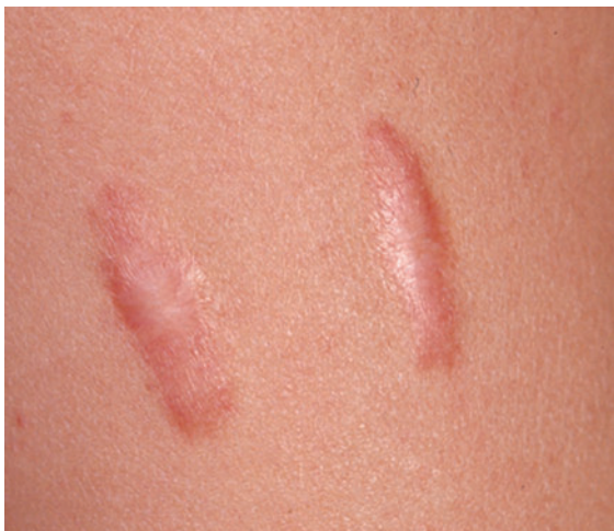
► Abb. 2 Hypertrophe lineare Narben sind erhaben und gehen über den ursprünglichen Schnitt hinaus. (Quelle: Czaika V. Effloreszenzenlehre. In: Neurath F, Lohse A, Hrsg. Checkliste Anamnese und klinische Untersuchung. 5., aktualisierte Auflage. Stuttgart: Thieme; 2018)

Im Folgenden werden die Goldstandards im ergo- und physiotherapeutischen Vorgehen hinsichtlich der Präventiv- bzw. der Problemtherapie aufgezeigt. Je ausgeprägter sich eine Problemnarbe darstellt, desto eher sollten auch ärztliche Interventionen eingebunden werden. Dazu zählen beispielsweise Kortikosteroidinjektionen, Operationen, Lasertherapie, Stickstofftherapie und das Microneedling.