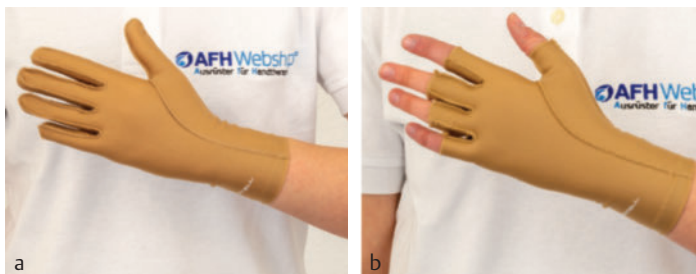
► Abb. 5 a, b Kompressionshandschuh mit und ohne Fingerspitzeinschluss.

getragen werden [20]. Nachteilig ist die Kurzlebigkeit der einzelnen Folien bzw. des Gels von ca. drei bis sechs Wochen [16] und die damit verbundene hohe Kostenintensität. Empfehlenswert sind Produkte der Marken ScarFX und RENOSIGEL.