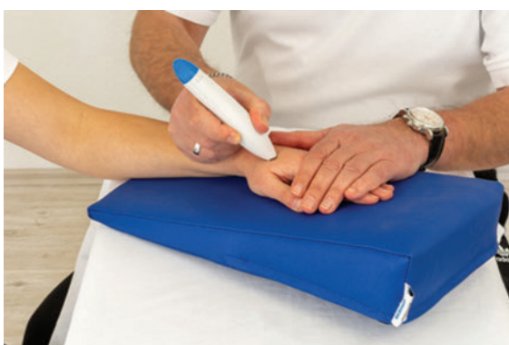
► Abb. 8 Vibrationsreize sprechen vor allem die Vater-Pacini-Körperchen in der Dermis an.

konzentriert und motiviert durchführen [2]. Je nach Befund werden die betroffenen Hautareale in starke und weniger starke hypersensible Areale gegliedert. Des Weiteren muss der Stimulus mit den geringsten Irritationen eruiert werden, mit dessen Reiz letztendlich der Desensibilisierungsprozess bzw. das Abhärtungstraining der Narbe einzuleiten ist. Die Stelle mit der größten Toleranz gilt als Ausgangsstellung, bis der adaptierte Reiz als angenehm empfunden wird. Es können Reize vom Wattebausch oder von Wolle bis hin zur Zahnbürste bzw. zu einem extra dafür konzipierten „Dermoroller“ mit vier unterschiedlichen Härtegraden verwendet werden (► Abb. 6 ). Vorteil des „Dermorollers“ ist, dass er neben der desensibilisierenden Wirkung auf die Drucksensoren der Oberhaut (Merkel-Tastscheiben und den Meissner-Körperchen) auch einen Massageeffekt aufweisen kann und somit weiterlaufenden Verwachsungen im Narbengewebe vorbeugt. Mit Erreichen des stärksten Widerstands kann bei großflächigen Arealen auch eine Nadelreizmatte Verwendung finden (► Abb. 7 ). Durch den Massageeffekt eines Vibrationsgerätes kann im Weiteren auch Irritationen der Vibrationsrezeptoren in der Lederhaut (Vater-Pacini-Körperchen) entgegengewirkt werden (► Abb. 8 ).