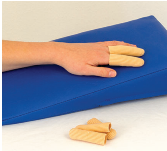
► Abb. 4 Digi-Sleeves eignen sich zur Kompressionstherapie von Fingernarben.

Silikonfolien sollten mindestens zwölf Stunden täglich, erfahrungsgemäß bis zu 23 Stunden über einen Zeitraum von mindestens zwei Monaten bis zu einem Jahr