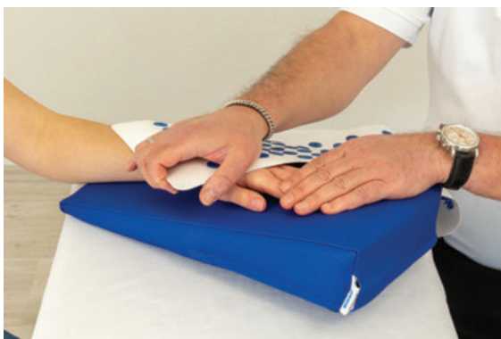
► Abb. 7 Die Nadelreizmatte kann in der letzten Phase des Desensibilisierungstrainings Anwendung finden.