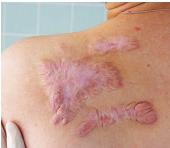
► Abb. 1 Flächiges (schweres) Narbenkeloid an der dorsalen Schulter.

Von Problemnarben sprechen wir beim Vorliegen von Schmerzen, Hypertrophie oder Keloidbildung.