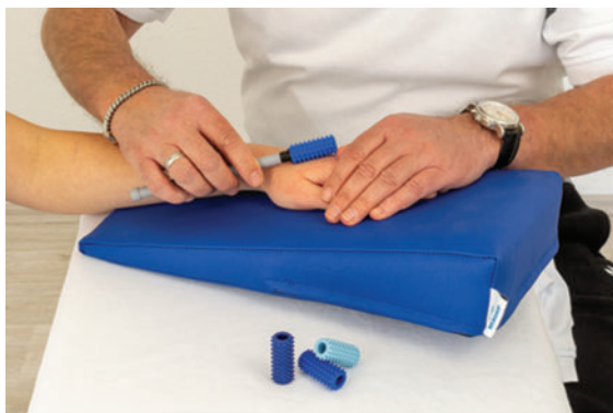
► Abb. 6 Der „Dermoroller“ desensibilisiert und massiert das Narbengewebe.