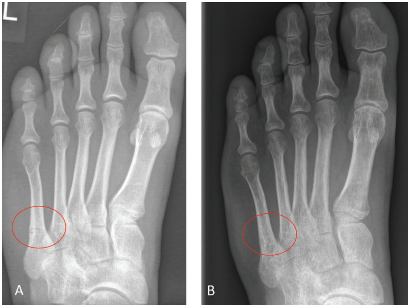
► Abb 2. A) Bild einer nicht heilenden MT-5-Fraktur bei compound heterozygot betroffenen Patienten mit frühkindlicher Erstmanifestation (Kraniosynostose); B) Konsolidierung 3 Monate nach Beginn der Enzyersatztherapie