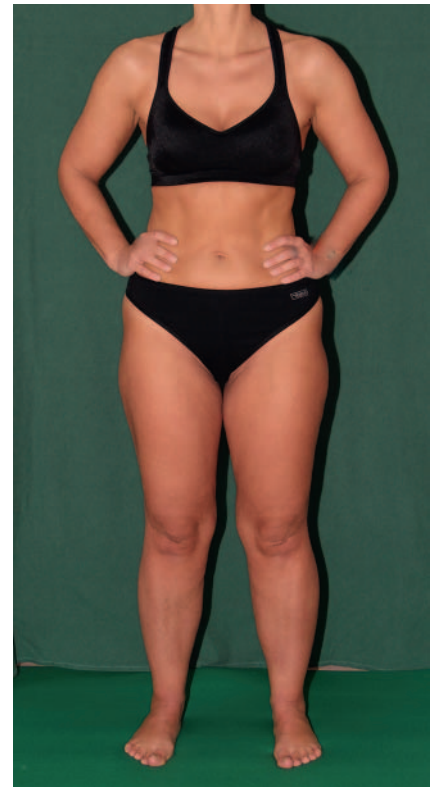
► Abb. 5 47-jährige Frau mit – aus medizinischer Sicht – gesunden Beinen.