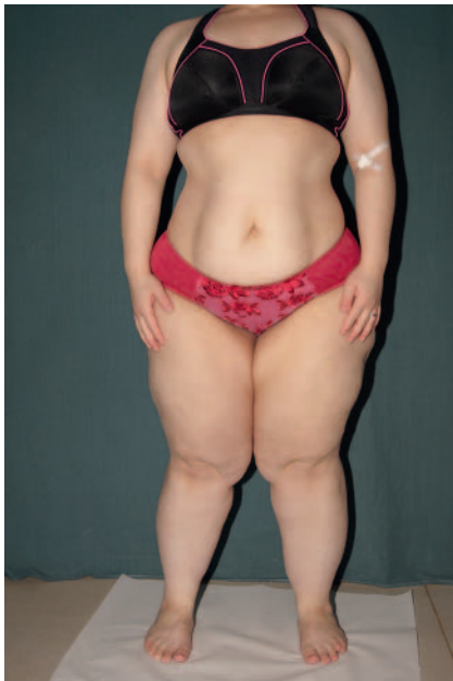
► Abb. 3 Patientin mit Adipositas und Lipödem-Syndrom.