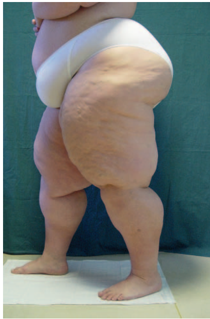
► Abb. 4 Patientin mit morbid Adipositas III° und Lipödem-Syndrom.