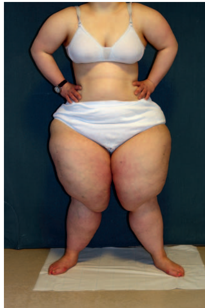
► Abb. 1 Patientin mit Lipödem-Syndrom und ausgeprägter disproportionaler Fettgewebsvermehrung der Beine.

Offensichtlich wurde hier von den Leserbriefautoren übersehen, dass unsere „crucial questions“ rein rhetorischer Natur waren, erfolgte doch die Beantwortung