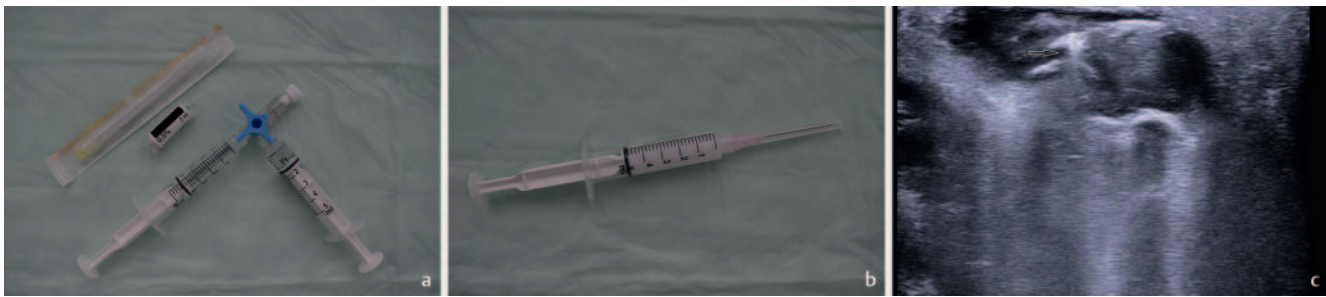
► Abb. 2 a Herstellung des Polidocanol-Schaums in einem Mischverhältnis von 4 (Luft): 1 (Polidocanol). b Fertiger Schaum. c Ultraschallkontrollierte Injektion des fertigen Polidocanol-Schaums im B-Bild (der fertige Schaum zeigt sich echoreich, die Nadel ist mit einem Pfeil markiert).

Durchführung ist neben dem vollständigen Entleeren der Seromhöhle (► Abb. 1b ) ein gut haftender Druckverband. Dieser kann z. B. inguinal in Form von aufgerollten sterilen Kompressen mit anschließender Anheftung breit-haftender Klebegaze und mit dem zusätzlichen Tragen einer Strumpfhose angelegt werden.