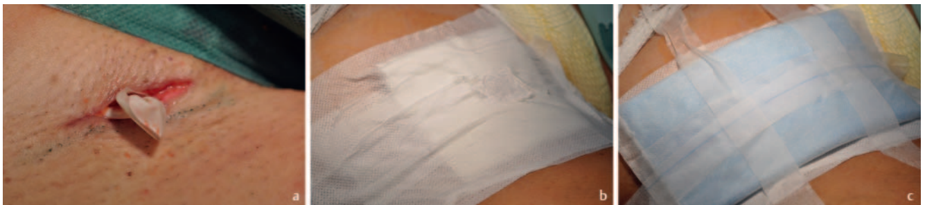
► Abb. 4 a Rechts inguinal: Einlage einer sterilen Handschuhlasche in die Seromhöhle. b Erste Schicht des 2-Schicht-Verbandes: Sterile Komresse, die mit Klebegaze versiegelt ist. Das zentrale Loch in der Klebegaze sorgt für den vereinfachten Abtransport der Seromflüssigkeit. c Zweite Schicht des 2-Schicht-Verbandes: Saugkomresse.

realisieren [12]. Auch hier erfolgt unter sonografischer Kontrolle zunächst die sterile Punktion und Aspiration der serösen Flüssigkeit. Im Anschluss wird flüssiges Doxycyclin über die von der Serompunktion liegende Nadel in die Seromhöhle gespritzt. Alternativ wird in der Literatur von der Verwendung von 500 mg gelöstem Doxycyclin in 25 ml Natriumchlorid berichtet [13]. Anschließend erfolgt die Anlage eines Druckverbandes. Über einen Off-Label-Use sowie die gängigen Nebenwirkungen von Doxycyclin sollten die Patienten vor der Durchführung schriftlich aufgeklärt werden.