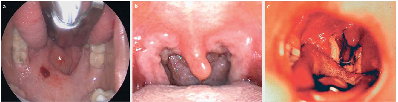
► Abb. 2 Spezifische Entzündungen in Mundhöhle und Pharynx. Repräsentative Aufnahmen von Manifestationen der Tuberkulose ( a * markiert durch Tuberkulose verursachte retropharyngeale Schwellung; [86]), der Syphilis ( b [166]) und der Diphtherie ( c [126]) in Mundhöhle und Oropharynx.

lich des für den Hals-Nasen-Ohrenarzt wohlbekannten Angioödems (Prävalenz circa 1 zu 100 000 Einwohner) sei auf einen aktuellen Übersichtsartikel von Bas [14] und auf die Leitlinie der Arbeitsgemeinschaft der Wissenschaftlichen Medizinischen Fachgesellschaften e.V. (AWMF; http://www.awmf.org ) verwiesen. Zu Störungen des Schmeckens, deren Inzidenz in Deutschland zusammen mit der Inzidenz von Riechstörungen auf ungefähr 50 000 neu auftretende Fälle pro Jahr geschätzt wird, sei auf die Leitlinie der Arbeitsgemeinschaft der Wissenschaftlichen Medizinischen Fachgesellschaften e.V. (AWMF; http://www.awmf.org ) verwiesen. Im folgenden Abschnitt soll nun auf seltene nicht-neoplastische Erkrankungen von Lippe, Mundhöhle und Pharynx näher eingegangen werden.