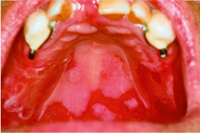
► Abb. 4 Blasenbildenden Autoimmundermatosen. Manifestation des Pemphigus vulgaris im Bereich des harten Gaumens (Bildmaterial aus [188]).

befall ist eine Komplikation des Pemphigoids, welcher zur Erblindung führen kann [172].