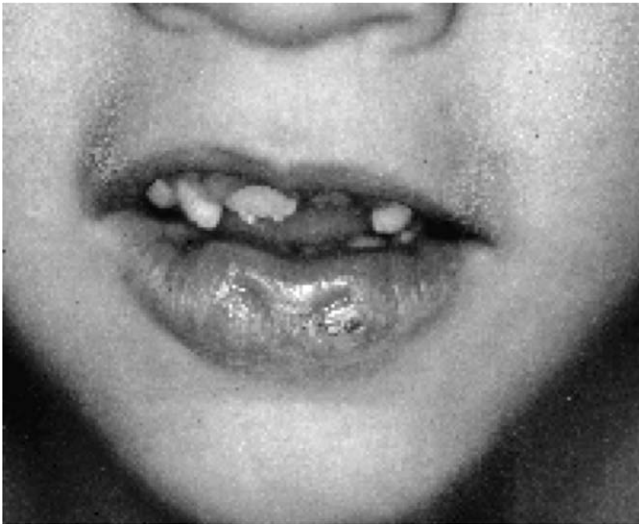
► Abb. 1 Unterlippenfisteln. Klinisches Bild von Fisteln im Bereich der Unterlippe (bilateral) eines 7-jährigen männlichen Patienten (Bildmaterial aus [40]).

Therapeutisch wird angestrebt, bis zum Zeitpunkt der Einschulung eine normale Atmungs-, Hör-, Sprach-, Sprech- und Kaufunktion herzustellen, was eine interdisziplinäre Therapie der betroffenen Patientinnen und Patienten erforderlich macht und als Primärbehandlung bezeichnet wird. Hierbei kommen kieferorthopädische, chirurgische, phoniatisch-pädaudiologische und logopädische Maßnahmen zum Einsatz. Der chirurgische Verschluss der Lippe erfolgt zumeist zwischen dem vierten und sechsten Lebensmonat bzw. mit einem Körpergewicht von mindestens 5 kg, der Verschluss des weichen Gaumens zwischen siebten und fünfzehnten Lebensmonat und der Verschluss des harten Gaumens zwischen zweitem und fünften Lebensjahr. Im Rahmen der Sekundärbehandlung werden Korrekturoperationen nach erfolgtem Spaltverschluss durchgeführt. Spaltbildungen im Bereich der Nase hingegen werden zumeist mit dem Erreichen des Erwachsenenalters korrigiert [195].