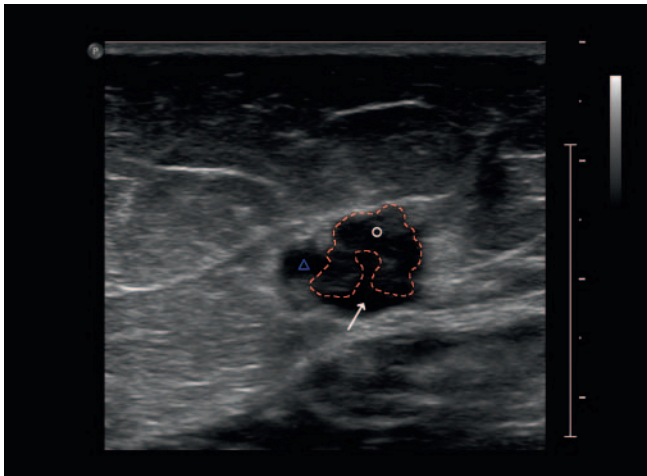
► Abb. 1 Sonografie. Transversalschnitt am distalen Oberschenkel rechts. Vena saphena magna mit großem, ins Venenlumen wachsendem Tumor (*, rot gestrichelte Markierung) mit Kompression der Venenlichtung (→). Mitschnitt eines einmündenden Seitenastes (Δ).

Aufgrund des unklaren Befundes mit persistierender Klinik sowie des dringenden Behandlungswunsches der Patientin wurde auf eine Biopsie verzichtet und eine direkte chirurgische Exploration und Resektion durchgeführt. Intraoperativ zeigte sich eine derbe Ektasie mit Verdacht auf postthrombotische Veränderungen.