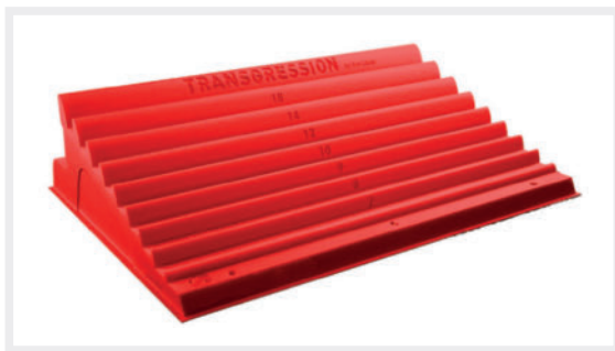
► Abb. 1 Das Trainingsboard Transgression hat Eva López entwickelt. Die Leisten haben eine Breite von 6–18 mm und ermöglichen so ein systematisches Training der Fingerkraft.

Stand und bei angemessener Periodisierung dazu beitragen kann, Fingerverletzungen vorzubeugen.