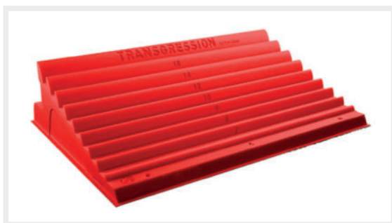
► Abb. 1 Das Trainingsboard Transgression hat Eva López entwickelt. Die Leisten haben eine Breite von 6–18 mm und ermöglichen so ein systematisches Training der Fingerkraft.

Stand und bei angemessener Periodisierung dazu beitragen kann, Fingerverletzungen vorzubeugen.