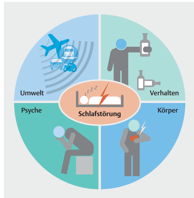
► Abb. 1 Ursachenbereiche für Schlafstörungen. Es werden körperliche (z. B. schmerzhafte Erkrankungen, Inkontinenz), psychische (z. B. Stress, psychische Störungen), verhaltens- (z. B. Rauchen, Alkohol) sowie umweltbedingte (z. B. Lärm, Licht) Ursachen für Schlafstörungen unterschieden.

In der Studie zur Gesundheit von Erwachsenen (n = 8152, Alter 18–79 Jahre) in Deutschland (DEGS1) berichtete etwa ein Drittel der Befragten über potenziell klinisch relevante Ein- oder Durchschlafstörungen und etwa ein Fünftel zusätzlich über eine schlechte Schlafqualität, wobei insgesamt eine Prävalenz von 5,7% für ein Insomniesyndrom ermittelt wurde [1]. In der aktuelleren DAK-Studie bei Erwerbstätigen von 2017 (n = 5207, Alter 18–65 Jahre) wurde für den Vergleich mit den Ergebnissen aus dem Jahre 2010 gezeigt, dass die Prävalenz der Menschen im Alter von 35–65 Jahren, die unter Ein- oder Durchschlafstörungen litten, von 47,5% auf 78,9% zugenommen hat, wobei lediglich 21,1% der Befragten berichteten, keine Schlafprobleme zu haben [2]. Dabei ist wichtig