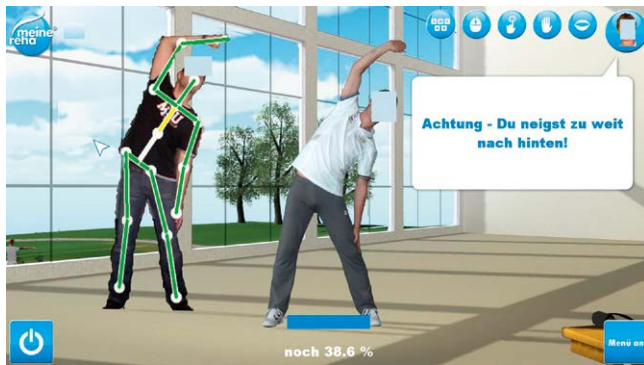
▶ Abb. 3 Analyse des Bewegungsablaufes und Korrekturmöglichkeit.