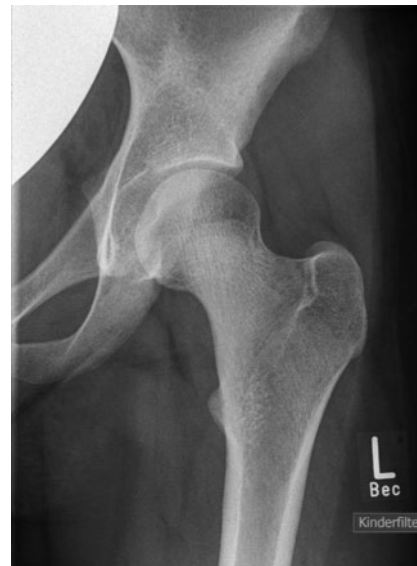
► Abb. 2 Röntgenbild der linken Hüfte der Patientin.

moderater funktioneller Einschränkungen gab die Patientin einen deutlich ausgeprägten Leidensdruck an. Eine initiale hausärztliche Vorstellung resultierte in der Diagnose „Wachstumsschmerzen“ und ein durchgeführtes Becken-MRT blieb unauffällig. Die erste ambulante kinderreumatologische Diagnostik ergab keine pathologischen Befunde. Insbesondere fanden sich zu keinem Zeitpunkt eine aktive Arthritis oder Anzeichen für klinische Folgeerscheinungen, wie beginnende Kontrakturen oder Fehlstellungen. Im Rahmen der weiteren Anamnese fand sich lediglich eine beidseitig operativ versorgte Inguinalhernie im Alter von 6 Jahren. Die Familienanamnese war frei hinsichtlich rheumatisch-orthopädischer Erkrankungen.